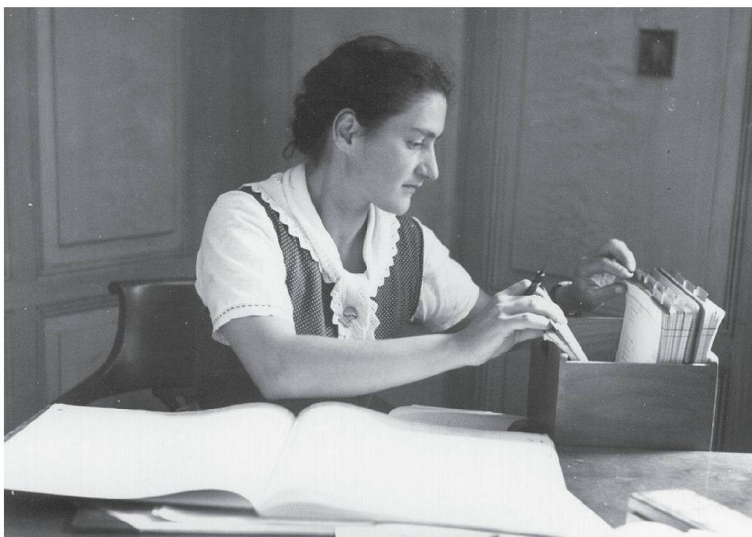
Abb. 1: «Aadorf (Thurgau), Die buchführende Bäuerin» – so untertitelt erschien dieses Foto in der zweiten Auflage von Ernst Laurs voluminöser Monographie Der Schweizer Bauer, seine Heimat und sein Werk , Bern 1947 (S. 737).

schon die häufige Praxis des Zurechtschneidens von Fotos für Publikationen erreicht viel. Solche Quellenkritik ist freilich nicht nur aufwendig, sondern häufig auch wenig erfolgversprechend. Es mag ja richtig sein, dass wir allzu oft nur sehen, was wir wollen; ebenso richtig ist aber auch, dass wir nur sehen, was wir sehen können . Und selten kommt es – wie im folgenden Fall – vor, dass eine Reihe von Zufällen uns aufdeckt, was «eigentlich» auf dem Foto zu sehen ist, wie es entstanden und wie es verwendet worden ist.