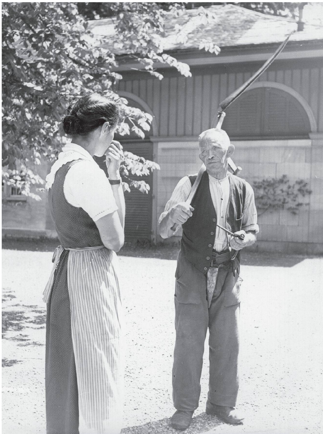
Abb. 4: «Die Betriebsleiterin gibt Anweisungen ...» Foto Theo Frey, Aadorf 1941 (Privatbesitz).

ufgwachse bin, bin ich nötig worde. Ich ha's als mini Pflicht aglueget, döt öppis us der Landwirtschaft z'mache.» Die Verwandten wurden ausbezahlt, der Betrieb – der trotz Fabrikabbruch und Reduktion des Parks ein kleiner Mittel-