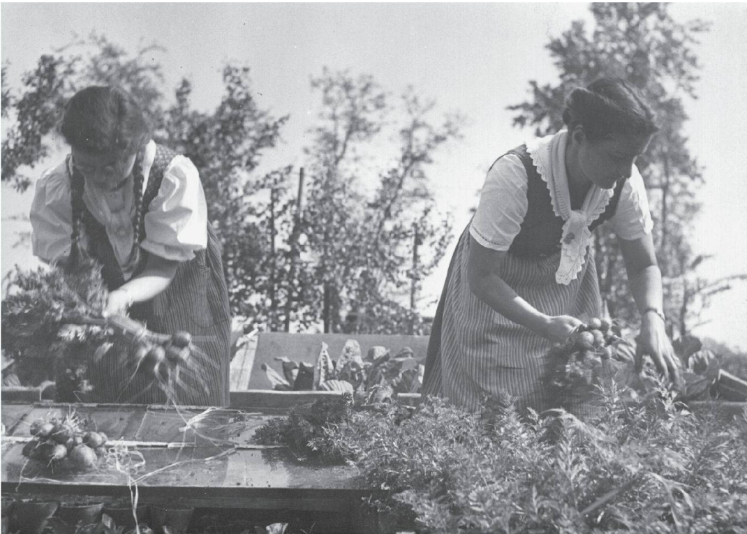
Abb. 5: «... und legt selbst Hand an.» Links im Bild ein jüdisches Flüchtlingsmädchen, das auf dem Hof mitarbeitete; die Radiozeitung bezeichnete es als Volontärin. Foto Theo Frey, Aadorf 1941 (Privatbesitz).

betrieb bleibt – aufgebaut; man glaubt ihr, dass sie in der Anfangszeit «schwärzchen und sparen» musste.