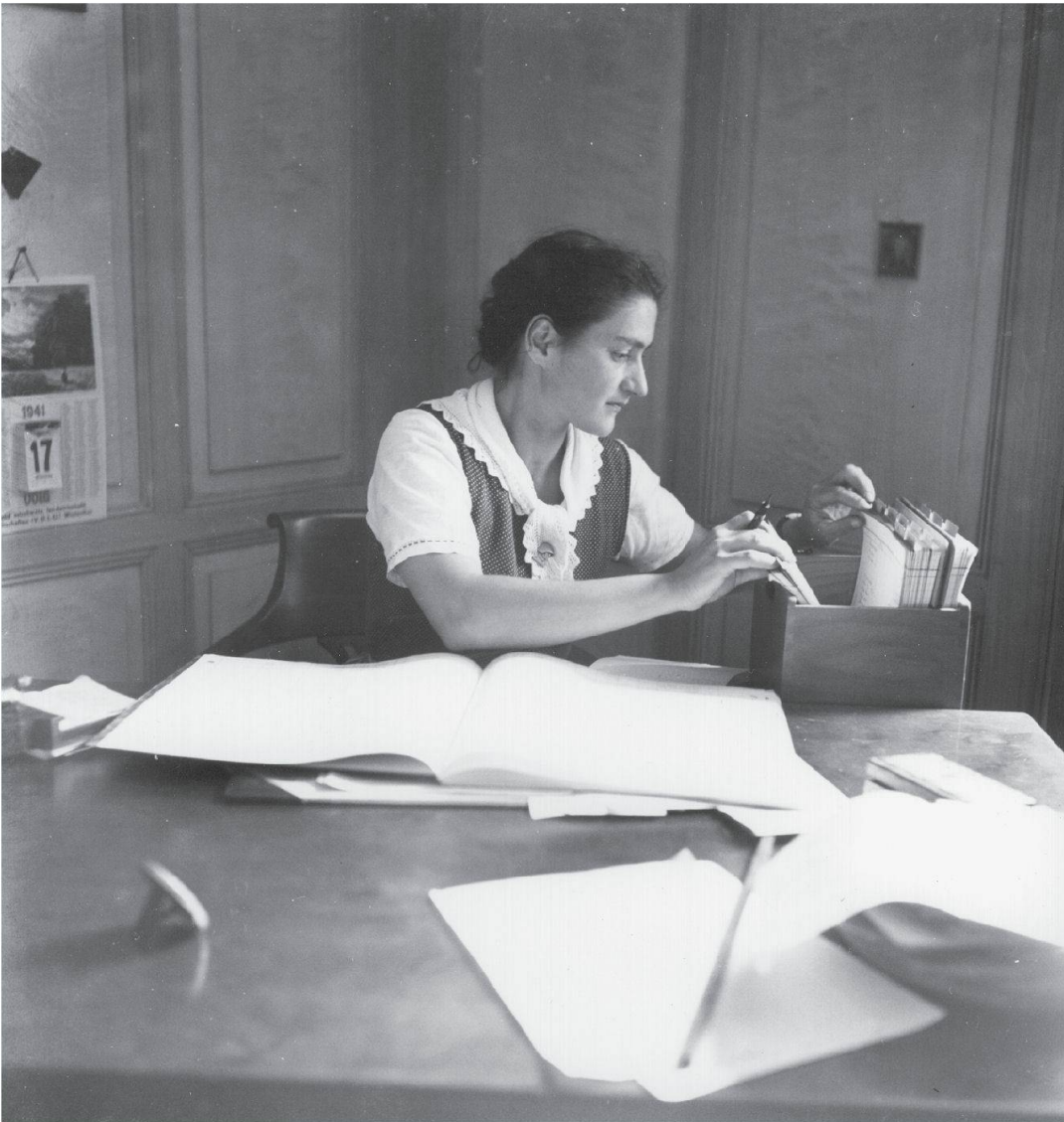
Abb. 2: Das Original. Foto Theo Frey, Aadorf 1941.

thode, rational-ökonomische Effizienz in den Bauernbetrieb zu tragen. Längst nicht mehr Subsistenz-, sondern Betriebswirtschaft zählt, und was vom Hof in die Küche kommt, wird fein säuberlich auf der Karteikarte eingetragen. Nur die Tracht signalisiert, dass eine Bäuerin abgebildet ist; wahrscheinlich ist sie Mitglied in der von Laurs Sohn präsierten schweizerischen Trachtenvereinigung. Dass der Bauernsekretär eine buchführende Frau abbildet, ist kein Zufall. Es war einerseits eine häufige Realität, andererseits wurde es auch von ihm selbst propagiert. «Würdigt besser die Arbeit der Frauen!» appellierte er 1928 in einem Vortrag an die bäuerliche Jugend. 6 Die Frauen sollten von harter Arbeit entlastet werden durch technische Einrichtungen (fliessendes Wasser, Haushaltmaschinen) und indem sie eben zum Beispiel die Buchhaltung ■ 159