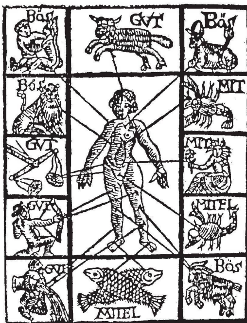
Abb. 2: Aderlassmann. Neuer und richtiger Schreib-Kalender, Zug 1758.

die Bedürfnisse einer neuen Käuferschicht hin, die den Kalender nicht mehr nur als medizinischen Ratgeber, sondern auch als ständig mitführbaren Zeitweiser schätzte.