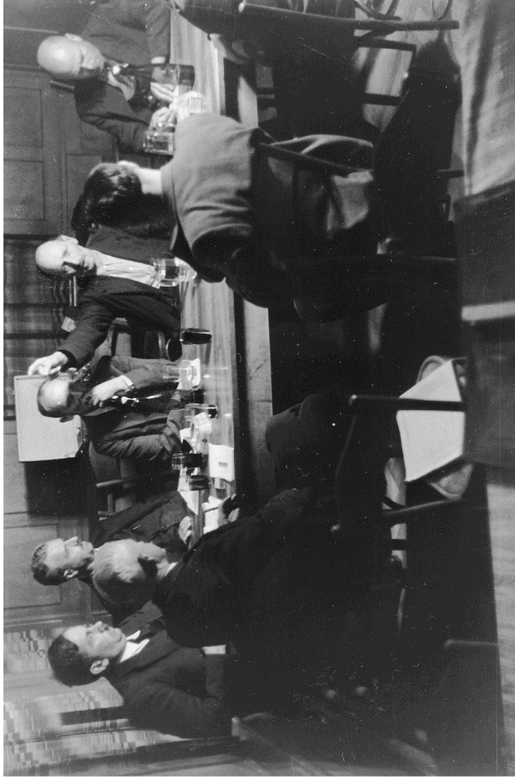
Abb. 5: Stickerversammlung im Rheintal 1938, Foto Hans Peter Klausner. (© Pro Litteris, 8033 Zürich, und Schweizerische Stiftung für die Photographie)