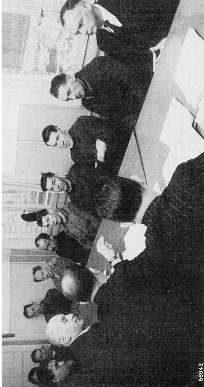
Abb. 3: Aufnahme der Arbeiterkommission in ungenanntem Betrieb, Fotograf unbekannt, in: Eduard Seiler et al., Das Schweizervolk und seine Wirtschaft. Gestern, heute, morgen, Zürich 1945 , 121. (Gretlers Panoptikum zur Sozialgeschichte, Zürich)