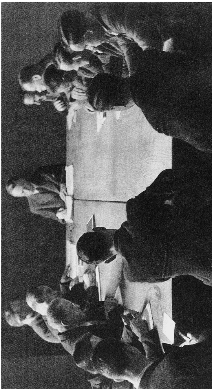
Abb. 2: Arbeiterkommission in unbekanntem Betrieb, Foto Theo Frey, 1944, in: Arbeit dem Schweizervolk. hg. vom Delegierten für Arbeitsbeschaffung, o. O. 1944, 14. (© Pro Litteris, 8033 Zürich)