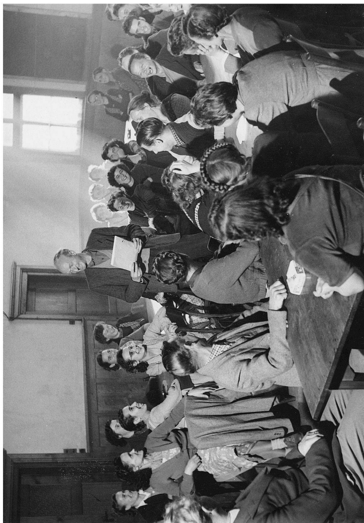
Abb. 6: Streikversammlung der TextilarbeiterInnen in Sils, Domleschg, 1946.