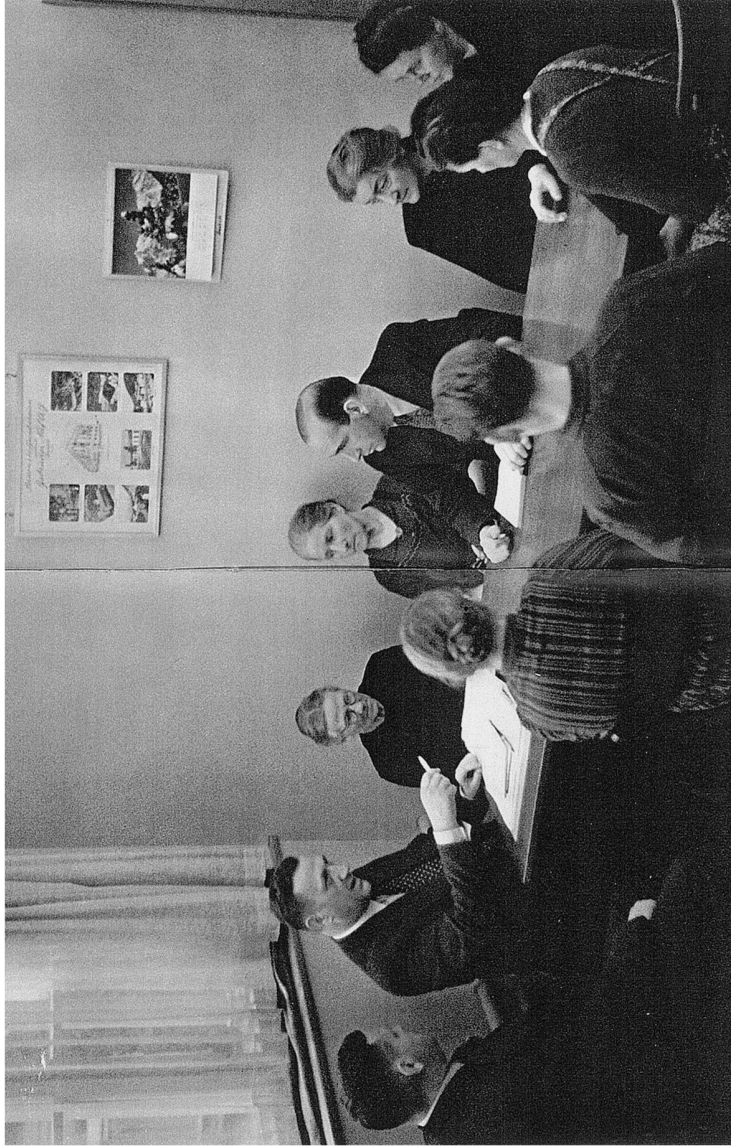
Abb. 1: Arbeiterkommission Weberei Náj, Foto Jakob Tuggener, 1945/46, in: Die Webereien der Familie Náj von Kappel