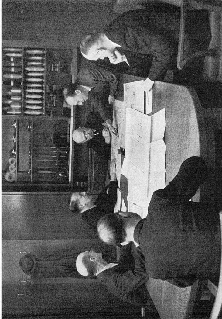
Abb. 7: Sitzung der kaufmännischen Leitung der Maschinenfabrik Rieter, Fotograf unbekannt, in: 150 Jahre Rieter, 1795–1945, Winterthur 1947, Bildanhang. (Gretlers Panoptikum zur Sozialgeschichte)