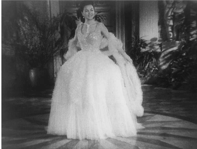
Abb. 4: ... gefällig und luxuriös im Brautkleid nach Machart von Dior, ebenfalls von Oestergaard.

Stoffe auszuhebeln. Also hiess es jetzt im Kommentar: «Diese zauberhaften Stoffe sind keine Wunschträume mehr. Jede Frau kann sie erschwingen.» (NDW 155). Die Kunstfasern der IG-Farben-Nachfolger ermöglichten es, so die Botschaft an das Kinopublikum, dass Mode vom hedonistischen Vorrecht der bürgerlichen Dame zu einer für alle Frauen zugänglichen Praxis werden könne. Um die national konnotierten Kunstfasern inszenierten die Bundeswochen-schauen eine umfassende Versöhnung sozialer Gegensätze. Dabei entwarfen sie verschiedene symbolische Visualisierungen für die harmonistische Sozial-ideologie der «nivellierten Mittelstandsgesellschaft». Mode aus teuren Natur-faserstoffen, die soziale Distinktion versprach, wurde nun kritisch-ironisch kommentiert, während Mode aus Kunstfasern zur diskursiven Trägerin sozialer Harmonie avancierte. Gleichzeitig wurde diese neue Mode jetzt als Schau-platz einer Versöhnung der Geschlechter inszeniert. Spielte die Darstellung der Schulze-Varellschen Luxusmode im Kommentar auf den zahlenden Herrn an, etwa mit der Bemerkung, das Abendkleid «Raspa» möge wohl «sehr angenehm in der Bar zu tragen» sein, es sei aber «sehr unangenehm in Bar zu ■ 139