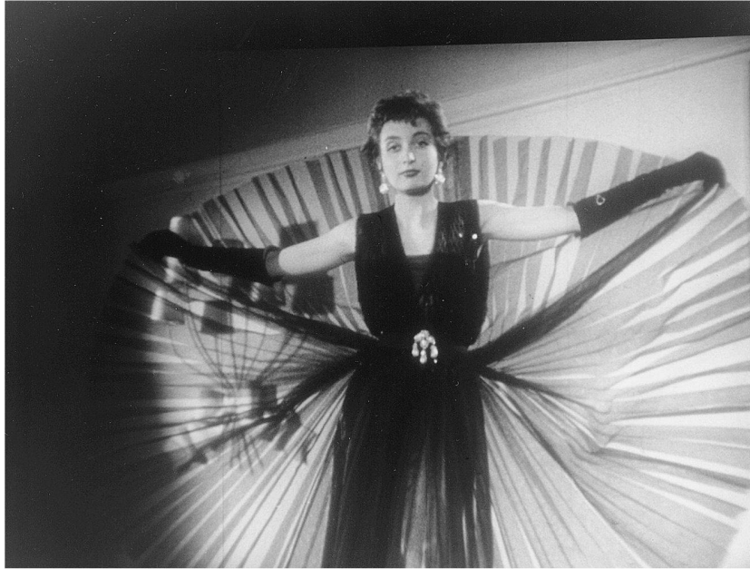
Abb. 1: Melodramatisches für die Dame mit gehobenem Anspruch und finanzkräftiger männlicher Begleitung: Das Modell «Nachtfalter» des deutschen Couturiers Heinz Schulze-Varell oder ...

Tagesmode an den Look der 20er Jahre an, etwa mit dem strengen Garbo-Look des wadenlangen Tageskostüms aus Tweed mit Männerhut (NDW 113, 1952). Die Abendkleider beziehen ihren Reiz aus dem Widerstreit zwischen der Fülle des Stoffs und seiner fast geometrischen Bändigung. Sie wirken kostbar und teuer, vor allem auch durch die im Kommentar hervorgehobenen edlen Naturstoffe wie Baumwollspitze, Organdi, Crêpe de Chine. Hier wird in einem dem Melodrama angelehnten filmischen Gestus die soziale Aufgabe der Dame, Geschmack und Kultiviertheit ihres Milieus zur Schau zu tragen, als eine ernste, ja tragische, bedrohte Weiblichkeit inszeniert (Abb. 1 und 2). Dieser Eindruck entsteht durch das sparsame Dekor antikisierender Spiegel, Säulen, Vorhänge und exzentrischer Lampen, in dem sich die Mannequins in einer kunstvoll choreographierten, fast traumwandlerischen Körpersprache graziöser Anpassung des Körpers an diese Beengtheit der Innenräume bewegen. Das Strenge und Bedrückt-Melancholische entsteht auch durch den durchweg ernstesten Gesichtsausdruck der «Starmannequins Jerry, Linda und Ill». Ihr Blick kontrolliert 136 ■ den Blick der Kamera, er konkurriert gewissermassen mit dem Kleid um die