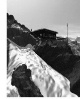
Der Berg La montagne Montagna

2008.2 Kunst + Architektur in der Schweiz Art + Architecture en Suisse Arte + Architettura in Svizzera