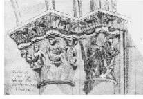
Territorio dell'art - Denkmaltopographie in Europa Territorio de l'art - Topographie des artistiques en Europe Territori dell'arte - Topografica artistica in Europa

2006.1 Kunst + Architektur in der Schweiz Art + Architecture en Suisse Arte + Architettura in Svizzera