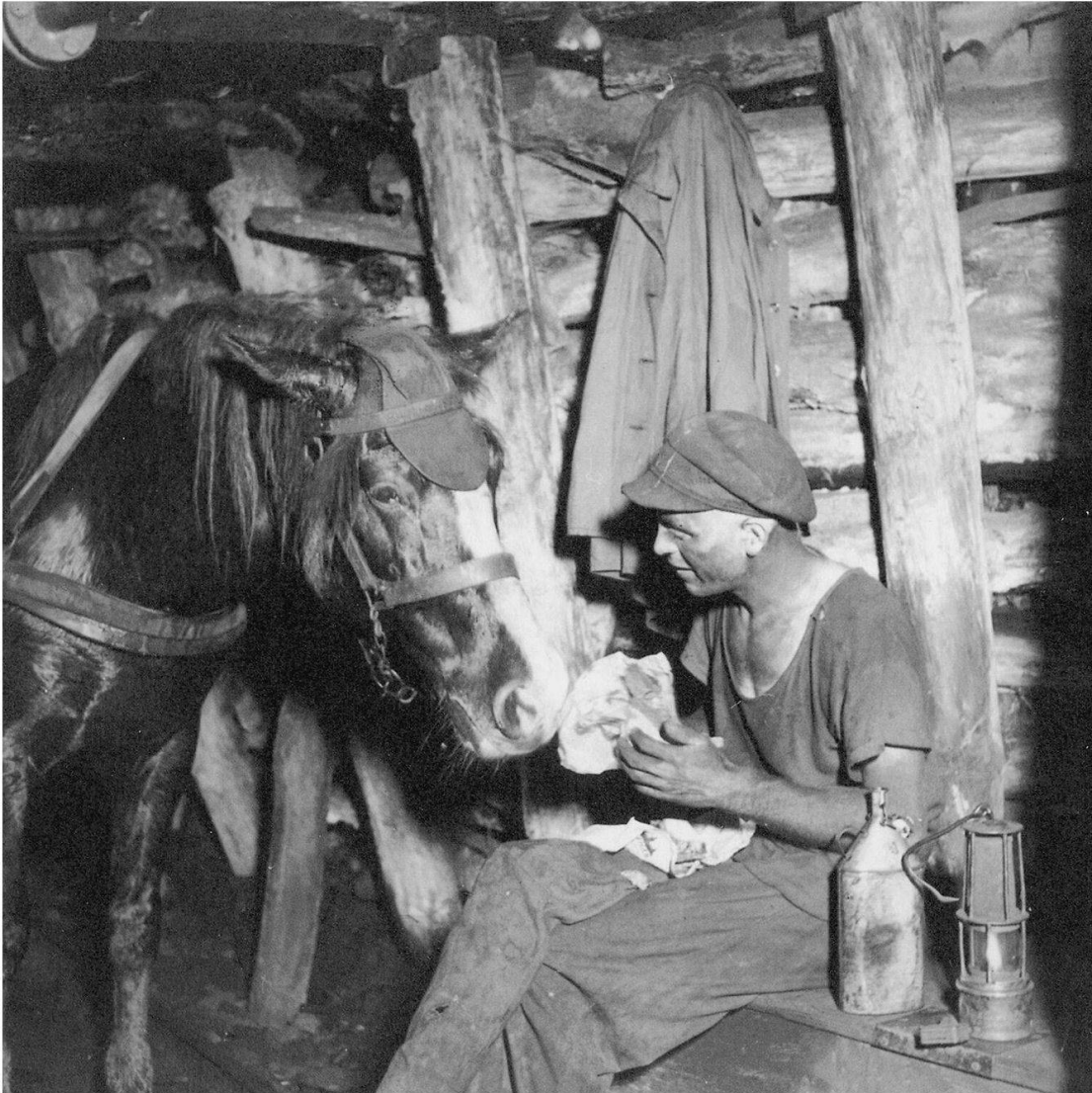
Abb. 2: Bergmann mit seinem Pferd beim Pausenbrot in der Zeche Robert Müser in Bochum, 1937.

Während die angebliche Erblindung der Grubenpferde kulturhistorisch-literarischen Zusammenhängen entstammt und mit der Realität nichts zu tun hatte, entsprach auch die «verbreitete Ansicht, dass häufig Augenverletzungen vorgekommen sein wären und ein Drittel der Pferde ein oder beide Augen verloren hätten [...] nicht den Tatsachen». Zwar gab es ein «entsprechendes Verletzungspotential an freiliegenden Elektro-, Wasser- und Luftleitungen, jedoch kam es nur in geringem Umfang zu derartigen Verletzungen». 15 Denn die Tiere trugen zu ihrem Schutz «Kopf-, Ohrenschutz und Stirnklappen aus harten Gummi bzw. Leder». 16 Hingegen waren die Pferde von Leiden wie Hufschäden oder infektiöse Erkrankungen wie Pferderotz oder Druse betrof-