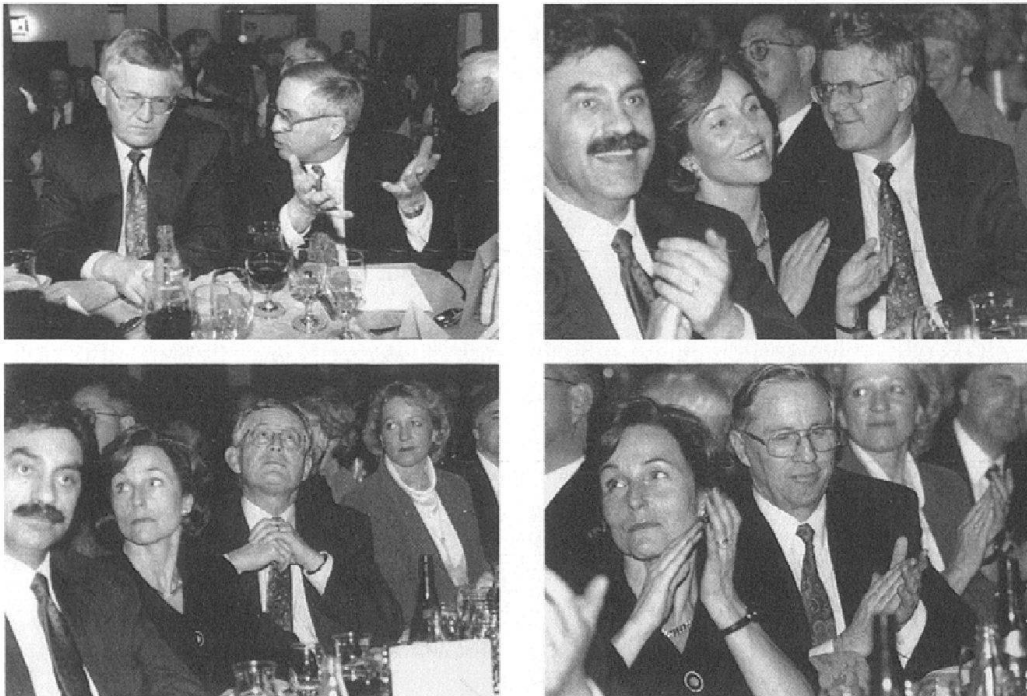
Abb. 5: Die «Blick»-Fotografin Sabine Wunderlin fotografierte 1995 die Albigüetli-Tagung der SVP, an der Bundesrat Kaspar Villiger teilnahm. Von der Reportage wurden vier Aufnahmen vergrössert und im Dossier «Politische Bewegungen» abgelegt: eine Aufnahme zeigt Christoph Blocher im Gespräch mit Bundesrat Villiger, auf zwei Bildern ist Bundesrat Villiger während Blochers Rede abgebildet und auf einer weiteren Blocher während Villigers Rede. Die Fotografin hat die beiden bewusst nicht nur als Redner, sondern ebenso als Zuhörer fotografiert: der Beifall klatschende Christoph Blocher und der nach oben oder zur Seite schauende Bundesrat Villiger.

mit spezialisierten Institutionen und Universitäten sowie mit andern öffentlichen und privaten Eigentümern von schweizerischen Fotoarchiven.