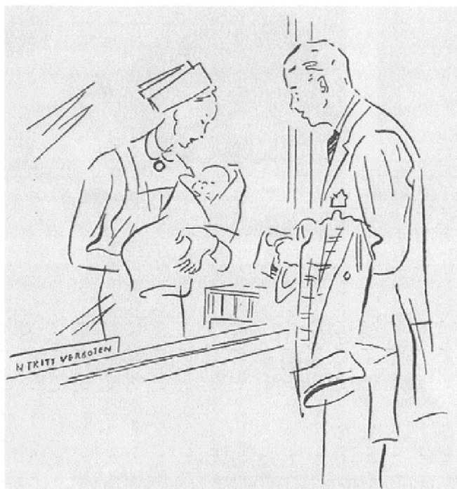
Abb. 6: Ferner Vater bei Benjamin Spock, 1952. (Spock [wie Anm. 24], 16)

die Berücksichtigung individueller Bedürfnisse des Säuglings auszeichnete. 23 Im Rahmen dieses Wandels thematisiert Benjamin Spock als einer der ganz wenigen Ratgeberautoren auch die Vaterschaft und propagiert – immer im Rahmen der traditionellen Rollenteilung – eine grössere Partizipation des Vaters an der Säuglingspflege: «Manche Männer sind in der Vorstellung befangen, dass die Kinderpflege ausschliesslich Sache der Mutter sei. Dies ist nicht richtig. Man kann ein zärtlicher Vater sein und zugleich ein ganzer Mann. [...] Natürlich will ich damit nicht sagen, dass der Vater ebenso oft die Flasche geben oder die Windel wechseln müsste wie die Mutter. Aber es ist nett, wenn er ihr ab und zu dabei hilft.» 24