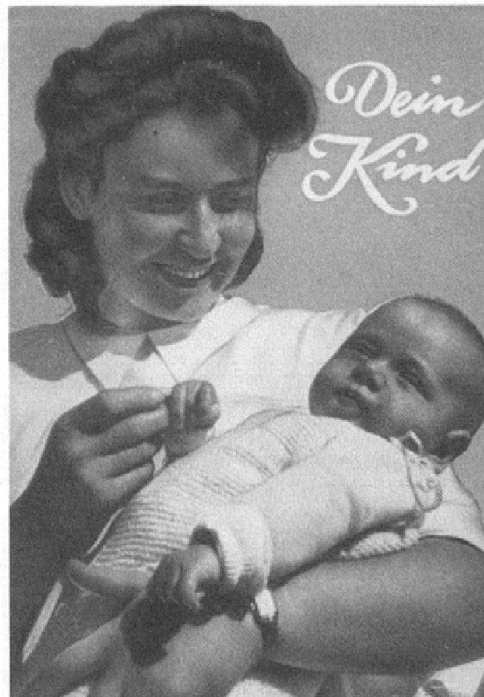
Abb. 1 und 2: Ratgeber der Pro Juventute , 1957 und 1959. (Kaiser [wie Anm. 19]; Umbricht [wie Anm. 19])

schritt für Arbeitsschritt vorzeigen. Mit diesen Anleitungen im Bild stilisieren die Ratgeber die abgebildeten Handlungen gleichzeitig zur Norm: Professionelle Säuglingspflege manifestiert sich in bestimmten Handlungsschritten, und nur durch diese kann Erfolg garantiert werden.