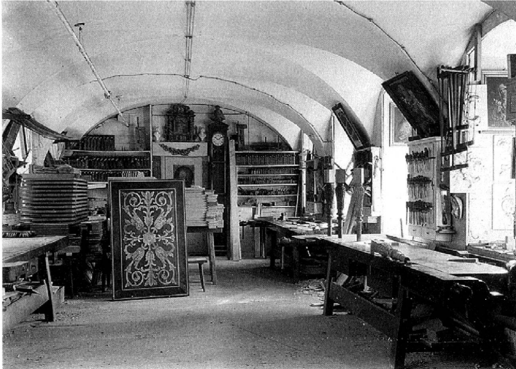
Abb. 4: Alte Schreinerei, circa 1910. Der Lesesaal und die Arbeitsräume des neuen Archivs sind in diesen Räumen untergebracht.

Zurzeit werden die Dias und Negativfilme digitalisiert und verschlagwortet. Bis Ende 2012 sollen insgesamt circa 30'000 Bilder im Bildarchiv online zur Verfügung stehen.