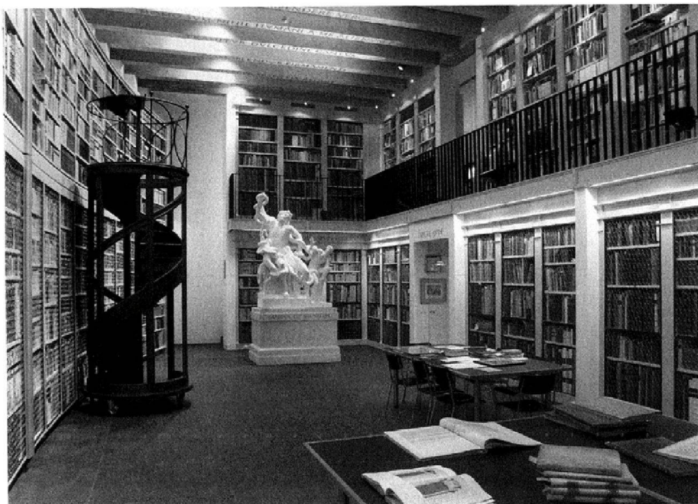
Abb. 4: Lesesaal und öffentliches Zentrum der Bibliothek.

tekturhistorikers wiederfinden. Im ersten Buch seiner De architectura schrieb Vitruv: «Die Architektur ist eine Wissenschaft bestehend aus vielen Disziplinen und sie ist ausgeschmückt mit mannigfaltiger Gelehrsamkeit [...]» 10 Auch vom Bauherrn fordert Vitruv eine umfassende Bildung in den Bereichen Arithmetik, Geometrie, Geschichte, Musik und Philosophie.