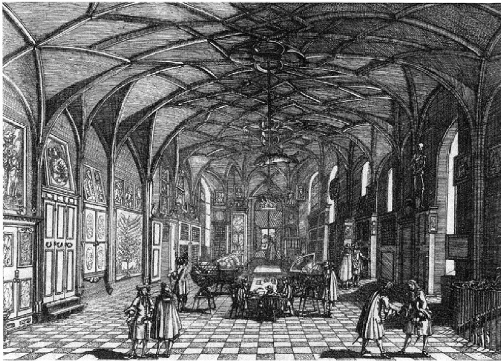
Abb. 2: Die Zürcher Kunstkammer auf dem oberen Boden der Wasserkirche. (Zentralbibliothek Zürich, Graphische Sammlung, Neujahrsblatt der Bibliotheksgesellschaft, 1688)

wurden Objekte aus der einheimischen Natur rege gesammelt, wie Scheuchzers Inventar aufzeigt. Daraus lässt sich nun durchaus ableiten, dass die Kunstkammer zu Beginn ein integrierter, räumlich nicht klar getrennter Bestandteil der Bibliothek der Zürcher Bibliotheksgesellschaft war, wie dies Rütsche sowie Barraud und Jezler annehmen. 24 Das Nichterwähnen von einheimischen Naturobjekten wie einem Bärenschädel im Sammlungsprogramm der Bürgerbibliothek aus dem Jahr 1629 lässt aber einen weiteren Schluss zu: In der Zürcher Bibliothek wurden Objekte gesammelt, die zu einem späteren Zeitpunkt an die Sammlung Zürcher Kunstkammer übergingen.