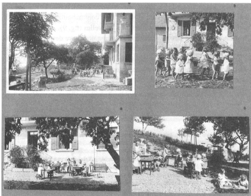
Fig. 9: Le Home Chez Nous , vers 1920, quartier de la Clochette, Lausanne, un foyer d'Education nouvelle érigé par Ferrière comme un véritable modèle d'application des méthodes pédagogiques préconisées par l'Institut Rousseau.

rapidement à un niveau mondial. Les écoles nouvelles, véritables laboratoires où s'expérimentent les méthodes nouvelles et se forment les professionnels de l'éducation, constituent des lieux essentiels où se développent de nouveaux savoirs. Elles pratiquent un enseignement respectant les besoins et intérêts de l'enfant où le maître joue le rôle de guide plutôt que celui de dispensateur de savoirs, où l'environnement stimule les apprentissages autonomes et la solidarité interpersonnelle.