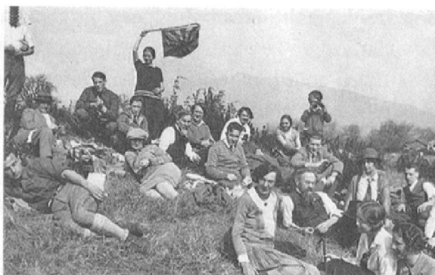
Fig. 2: Une sociabilité estudiantine qui associe étroitement temps d'études et intermèdes de loisirs, et marquera les premières générations de diplômés, 1928.