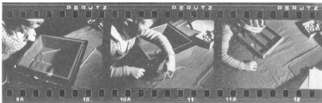
Fig. 4: Une scène de «testing», circa 1950: une ressource documentaire de première main pour connaître l'évolution des matériels et des pratiques de laboratoire dans le domaine de la psychologie de l'enfant.

Circulations d'expérience, échanges de pratiques, flux d'informations entre experts: telle est la base du fonctionnement de l'Institut dès ses premières décennies. Rien d'étonnant que s'y concrétise la mise sur pied d'une agence internationale ayant vocation à centraliser l'information, plus particulièrement dans le domaine de l'organisation scolaire: le Bureau International d'Education (1925). Partenaire des grandes organisations intergouvernementales créées à Genève autour de la Société des Nations, le BIE consolide sur le plan des politiques éducatives les liens transnationaux qui ont contribué à l'élaboration des politiques nationales de protection et de sauvegarde de la jeunesse. L'ambition internationale de l'Institut se manifeste aussi par une volonté de fédérer les divers acteurs et courants de l'Education nouvelle.