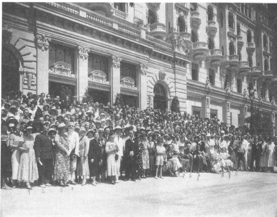
Fig. 8: Congrès de la Ligue internationale pour l'Education nouvelle (Nice, 1932). L'internationale des congrès scientifiques, un lieu d'échanges, de concurrences et de sociabilité transnationales. (Fonds Helena Antipoff)

l'enfant et de faciliter des réseaux de collaboration (fig. 8). Plusieurs membres de l'Institut Rousseau participent à ces manifestations, en particulier Bovet et Ferrière qui sont les chevilles ouvrières des deux congrès ayant lieu en Suisse, à Montreux en 1923 et à Locarno en 1927.