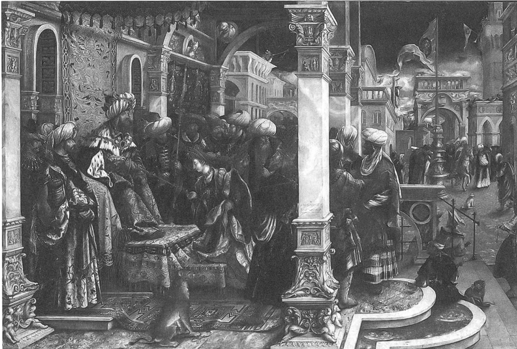
Abb. 2: Hans Burgkmair der Ältere, «Die Geschichte der Esther», 1528. Ausschnitt. (Alte Pinakothek, München)

Bei zeremoniellen Inszenierungen schöpfte man die materiellen und bildhaften Ressourcen von Teppichen aus: Die oftmals hochwertige Zusammensetzung der Teppiche wurde dabei ebenso genutzt wie der dekorative Charakter, der die auf das Bühnengeschehen erhobenen Handlungsträger einrahmte. Zudem ermöglichten die geometrischen Muster eine dreidimensionale Raumgestaltung durch das Auslegen oder Aushängen von kostbaren Teppichen. 41