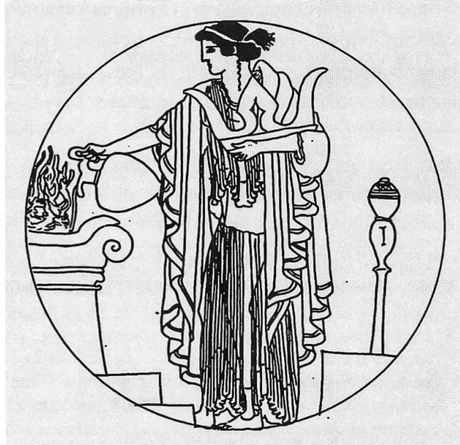
Fig. 3: Coupe attique à figures rouges de Macron, vers 490–480. (Toledo Museum of Art, 1972.55)

combats, parfois virulents des Pères de l’Eglise contre la religion traditionnelle (qu’elle soit grecque, romaine ou juive), l’expression des sens trouve toute sa place dans la liturgie de l’Antiquité au Moyen Age; elle s’adapte à une nouvelle expression du divin.