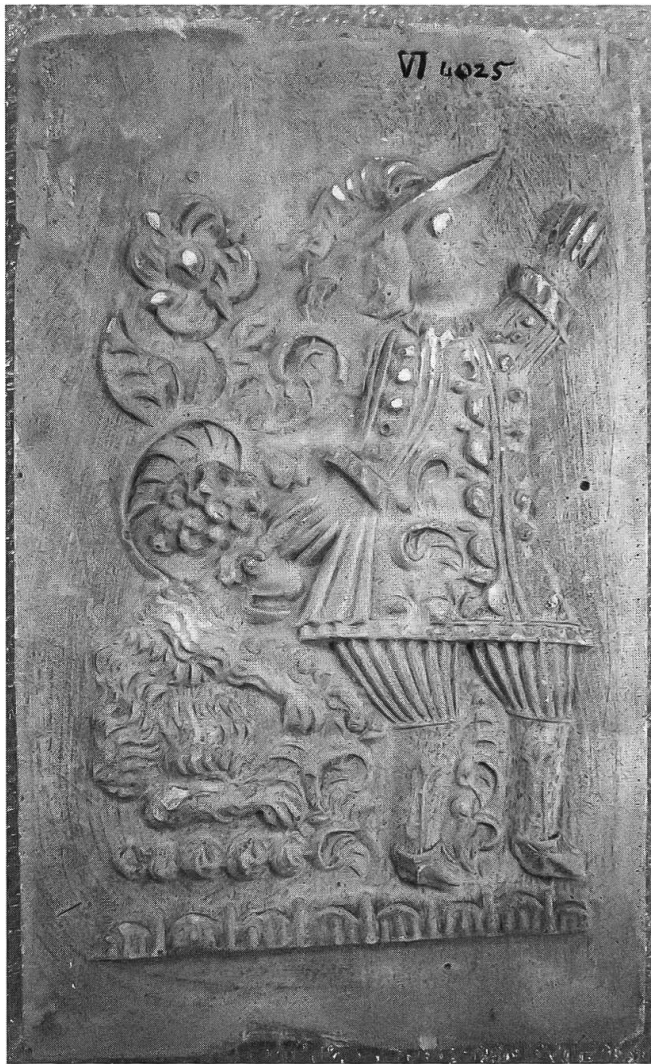
Abb. 3: VI 4025.01, Gipsabguss eines Änisbrot-Models.

Bildschirm in einen «originalen» Model und einen «nichtoriginalen» Abguss umgewandelt worden. Wir könnten auch sagen, das Objekt wurde wahrnehmungstechnisch in ein «Original» und seine «Kopie» getrennt.