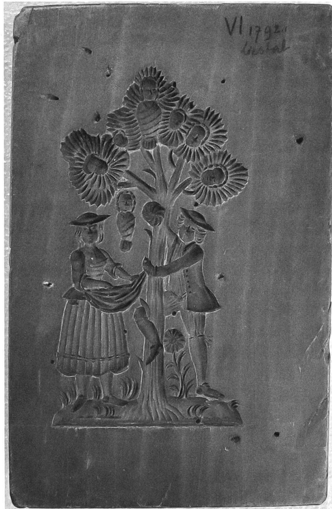
Abb. 2: VI 1792.01, Holzmodel, Rückseite. (Foto: Karin Renold, 2013. © Museum der Kulturen Basel)

Aus den zwei Abdrucken wurde also ein Stempel und ein Abdruck von diesem Stempel «gemacht». Waren diese Abdrücke von Brotstempeln und Gipsabgüsse damals vollwertige Museumsobjekte, ist anscheinend spätestens mit der Digitalisierung der Bestände ab den 1990er-Jahren, sehr wahrscheinlich vorher, nicht mehr vorstellbar, dass ein Abguss oder ein Abdruck ein eigenständiges Objekt ist. VI 4025 zum Beispiel kam 1910 in die Sammlung des Basler Museums (Abb. 3, S. 174). Es ist ein Gipsabguss. Im digitalen Katalog TMS sind heute zwei Unter-Objekte eingetragen, und zwar ein Abgeformtes (VI 4025.01) und ein formgebender Model (VI 4025.02). Im Depot des Museums ist jedoch nur eines auffindbar, und zwar der Gipsabguss. Wie bei den zwei oben erwähnten Abdrucken von Brotstempeln scheint auch hier spätestens mit der Digitalisierung das Abgeformte, die Kopie, nicht mehr alleine (be)stehen zu können. 14 Bei der Aufnahme in die digitale Datenbank ist dieser einst «originale» Gipsabguss am