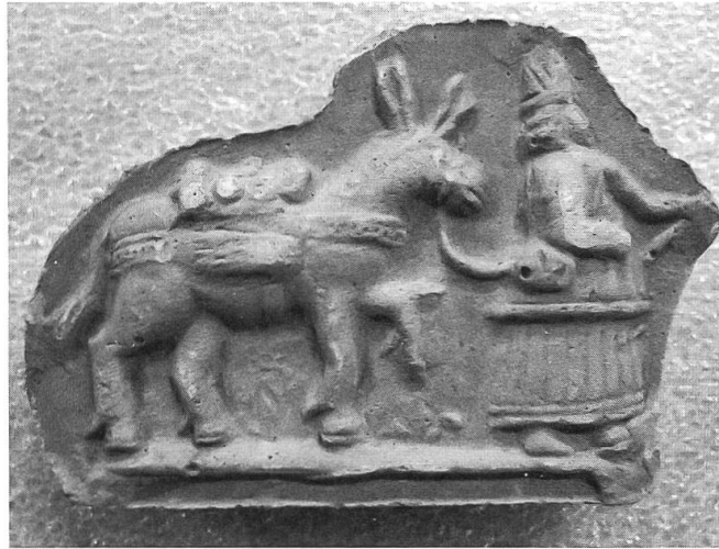
Abb. 5: VI 626.01, Gipsabguss eines Änisbrot-Models, Rückseite.