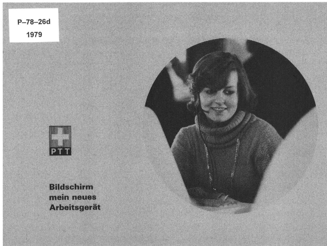
Ill. 3: Arrivée d'écrans de travail aux PTT et explications aux employées comment s'y prendre, 1979.

munications, financée par La Poste Suisse SA et Swisscom SA, elles collaborent notamment avec les départements juridiques et ceux de la communication de ces deux entreprises. Ces échanges permettent en plus de mettre en valeur des sources inédites provenant de l'ancienne régie fédérale.