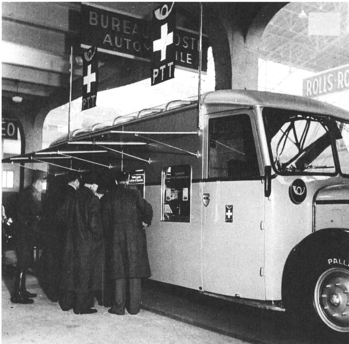
Ill. 2: Premier bureau de poste mobile suisse pour événements particuliers, 1937.

de la communication, il y a par exemple ceux de l'Union postale universelle (UPU) 15 et de l'Union internationale du télégraphe (UIT). 16 Le développement d'un réseau international de communication peut également s'observer à travers la poste aérienne. Le fonds à ce sujet contient entre autres des documents administratifs, des statistiques, de la correspondance entre les offices postaux des différents pays concernés par ces liaisons aériennes, des revues de presse ou des horaires de vol. 17