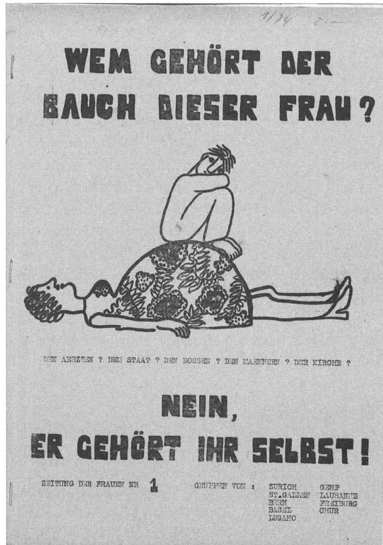
Abb. 2: Titelblatt der Zeitung der Frauen von 1973. (SozArch, Ar 465.10.1, FBB 063, Teil 1)

Jahr 1973 die oben erwähnte Zeitung der Frauen . 31 Auf der Titelseite dieser Zeitung ist die Zeichnung einer liegenden, schwangeren Frau abgebildet, auf deren Bauch ein Mensch kauert. Ober- und unterhalb der Illustration steht in dicken Lettern: «Wem gehört der Bauch dieser Frau? Den Ärzten? Dem Staat? Den Bossen? Den Männern? Den Kirchen?» Die Herausgeberinnen der Zeitung wissen die Frage auch gleich unmissverständlich und in gut sichtbarer Schrift zu beantworten: «Nein, er gehört ihr selbst!»