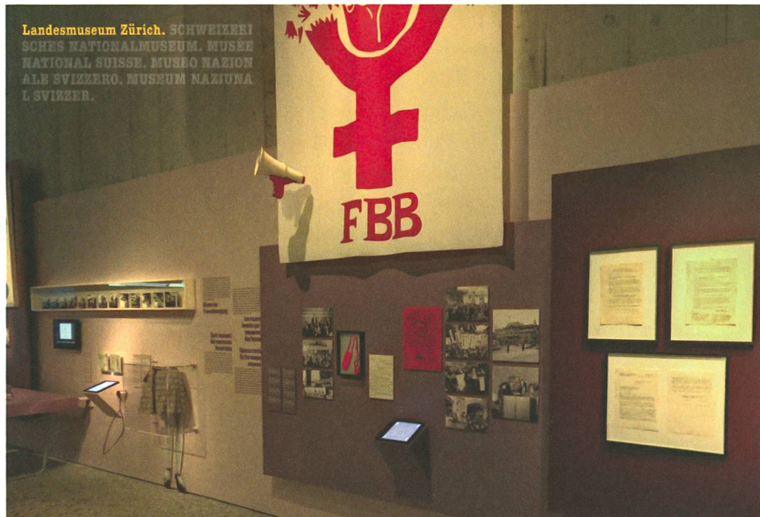
Abb. 2: «Frauen.Rechte», 2021, Bildausschnitt aus dem virtuellen Ausstellungsrundgang.

links und rechts des Peniswärmers vermittelten Einblicke in Schlüsselmomente der Geschichte der FBB und belichteten die historischen Zusammenhänge, welche die Entstehung und Wirkung der Peniswärmer in den 1970er-Jahren begleitet und mitgestaltet hatten. Die Assemblage wurde nicht von einer narrativen Erzählstruktur zusammengehalten, sondern durch das lila gestrichene Wandstück, das die einzelnen Exponate gestalterisch zusammenführte. Diese szenografische Inszenierung suggerierte einen inhaltlichen Bezug zwischen den Aktionen der FBB und den gestrickten Peniswärmern von Doris Stauffer, die in dieser Eindeutigkeit zumindest zu hinterfragen wäre, hatte doch die FBB in den 1970er-Jahren auf eine Aktion mit den Peniswärmern verzichtet.