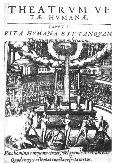
Abb. links: Saal des Théâtre Pigalle, Paris, Aufnahme 1934 rechts: aus: Theatrum vitae humanae, a. I.I. Boissard ... Metz, 159) Seite 25: Hiroshi Sugimoto, „Paramount, Oakland, 1994“, in: Time Exposed, Katalog Kunsthalle Basel 1995

Vorbereitet wird diese Entwicklung natürlich in einer Institution, die einst mit dem Anspruch angetreten war, die „Wirklichkeit“ in die Wohnzimmer zu bringen und die nun die ihr eigenen Bedingungen konsequent zu Ende denkt: „Die Virtualisierung des Fernsehens könnte ein Prozess