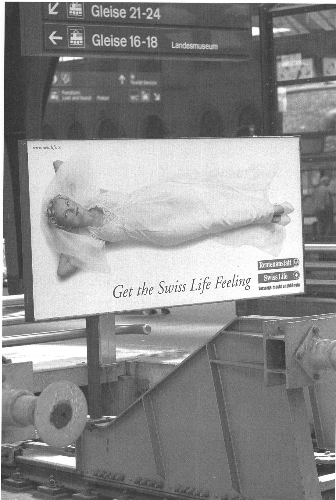
Bildserie „Spaziergang“ von Peter Tillessen.