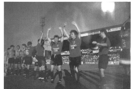
Alla sinistra (1995) Fussballaktion