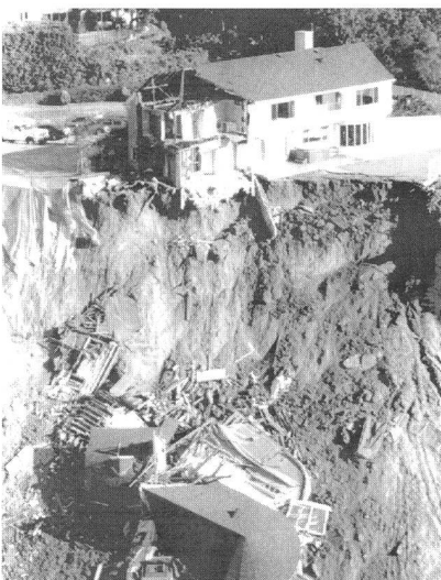
Gianni Motti: Erdbeben (1992) Bekennerphoto, Beweise

Als Motti im März 1997 für einen Monat an den Expacio Vacio , ein Kunstzentrum in Bogotá, eingeladen war, begann er mit einer auf die dortige Kunstwelt beschränkten Aktion, die allerdings bald politische Dimensionen annahm. Er führte seine Aktion Psy-Room durch, während der er in der Art eines Psychologen die Besucher empfing und sich gegen Honorar ihre Probleme und Wünsche anhörte. Die Sitzungen waren vertraulich, aber Motti stellte bald fest, dass es mit der politischen Situation in Kolumbien nicht zum besten stand. In den meisten Gesprächen tauchte der Präsident Kolumbiens, Ernesto Samper Pizano, als Hauptgrund der Misere auf. Motti entschied sich, den Präsidenten ebenfalls zu einer psychologischen Sitzung einzuladen. Als er keine Antwort auf sein Anliegen erhielt, gab er bekannt, dass er sich zum Präsidentenpalast begeben und den Präsidenten per Hypnose zum Rücktritt bewegen würde. Die Meldung wurde von der nationalen, oppositionellen Tageszeitung El Espectador verbreitet. Zum angekündigten Zeitpunkt fand sich Motti mit Hunderten von Künstlerkollegen vor dem Palast ein, während zu Hause Tausende von Kolumbianern sich am telepathischen Ereignis beteiligten. El Espectador brachte ein Photo von Motti auf der Titelseite. Als die Verantwortlichen des Kunstzentrums bedroht wurden, brachten sie Motti vor dem angekündigten Datum heimlich ausser Landes.