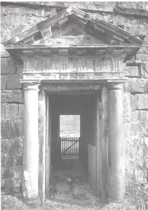
Abb. 4: Detail der Frew's Bridge