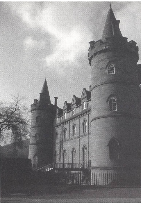
Abb. 7: Das (modernisierte) Schloss