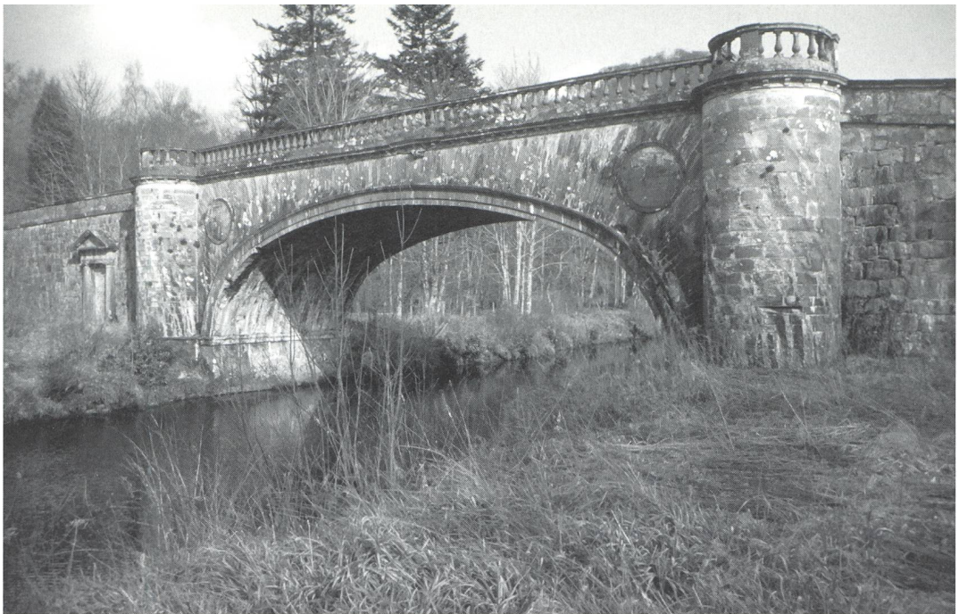
Abb. 3: Frew's Bridge