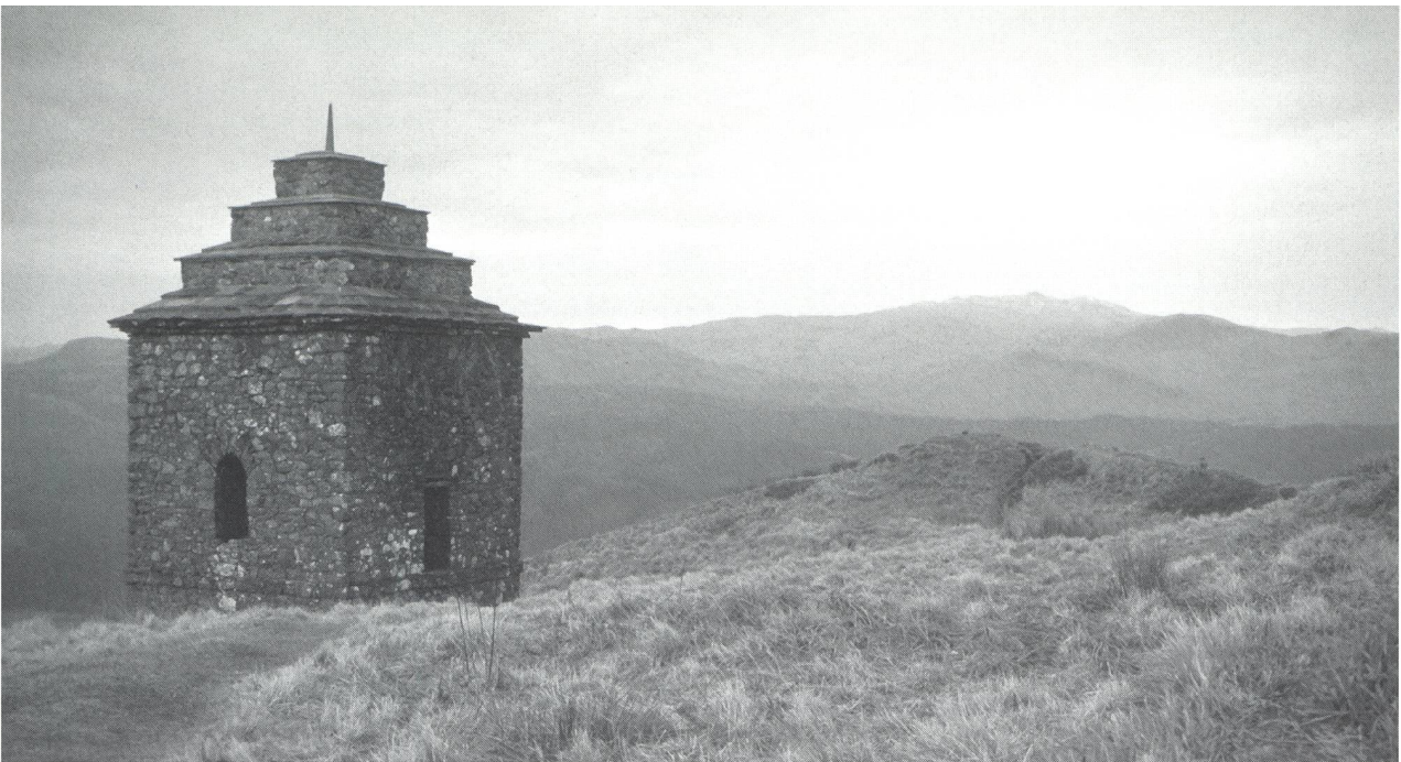
Abb. 6: Der Aussichtsturm auf dem Duniquaich

der Gartenästhetik so wichtigen Sublimen zu ermöglichen. Dem Betrachter bot sich eine überwältigende Landschaft, die allein durch ihre schiere Überdimensionalität Gefühle des Erhabenen hervorrief. Der Schlosspark fügte sich mit seinen Baumgruppen in die umgebende grandiose Kulisse aus Berghöhen und Wasserflächen ein. Durch die Betrachtung der dem klassischen Ideal verpflichteten 'New Town' stellte sich dem Sublimen der angenehme Gefühlszustand des 'Schönen' gegenüber. Die Parkgestaltung selber wurde wiederholt verändert. Unter Archibald Campbell dominierte wohl die von Capability Brown propagierte Verbindung von natürlicher Landschaft und kunstvoller Gartenarchitektur. Das neugotische Schloss kam - wie gesehen - diesem Anliegen entgegen. Ein pittoresker Blick führte auf ein Taubenhaus, das ausserhalb des Parkes stand. Die Übergänge zwischen Park und 'Freinatur' waren fließend. Ein zurückhaltender Einsatz klassizistischer Formen, etwa beim Bau der Gartenbrücke (Abb. 4), unterstützte die angestrebte Verschmelzung von natürlicher Flusslandschaft und gestaltetem Park. Erst 1802 wurde ein kleines heptagonales Sommerhäuschen oberhalb der Aray-Kaskade errichtet, um den Besuchern den malerischen Reiz dieses Anblickes möglichst bequem zu ermöglichen. Bereits früher schon war ein grottoähnliches Quellhäuschen errichtet worden, das die Formensprache der Brücken aufnahm. Der Plan, das Taubenhaus in einen sibyllinischen Rundtempel zu verwandeln, wurde aus Geldmangel nie realisiert.