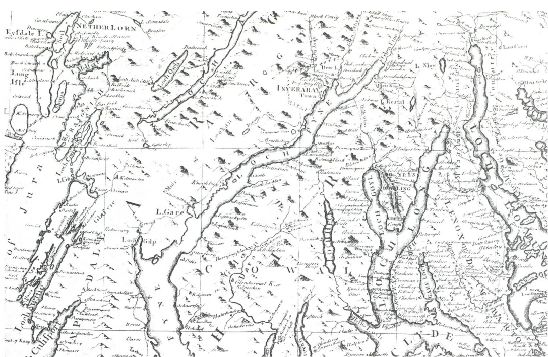
Abb. 1: Teil von Argyll (1750), mit Inveraray am Ende des Loch Fyne.