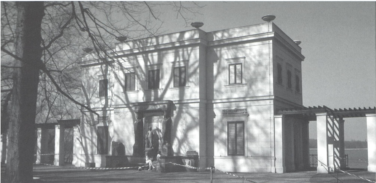
Abb. 3: Karl Friedrich Schinkel, Berlin-Wannsee, Kasino im Schlosspark von Glienicke (1824-25), Ansicht der Parkseite

Eine solche Architektur erfüllt auf elementare Weise archetypische Grundbedürfnisse – etwa das Getragen- oder das Emporgehoben werden, das An-einen-Abgrund-Treten und die Umgebung überschauen können, das Sich-Niederlassen und Ruhen oder das Frei- und-doch-geborgen-Sein. Und wo Architektur derartigen Grundbedürfnissen entspricht oder zumindest entgegenkommt, kann im Menschen ein sinnvolles Gefühl für sein Dasein in der Welt aufkommen. Solche Architektur berührt uns in der Tiefe unserer gesamten Existenz. Sie betrifft unser Lebensgefühl unmittelbar und elementar.