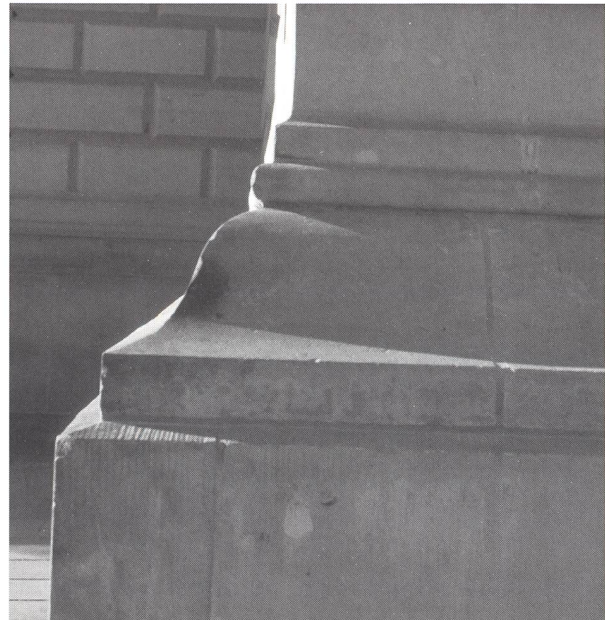
Abb. 2: Karl Friedrich Schinkel, Berlin-Mitte, Königliches Schauspielhaus (1818-21), Detail der Sockelzone

Ein wesentlicher Grund für die intensive Ausstrahlung von Schinkels Bauten ist die von ihnen ausgehende atmosphärische Kraft. Ein besonders gelungenes