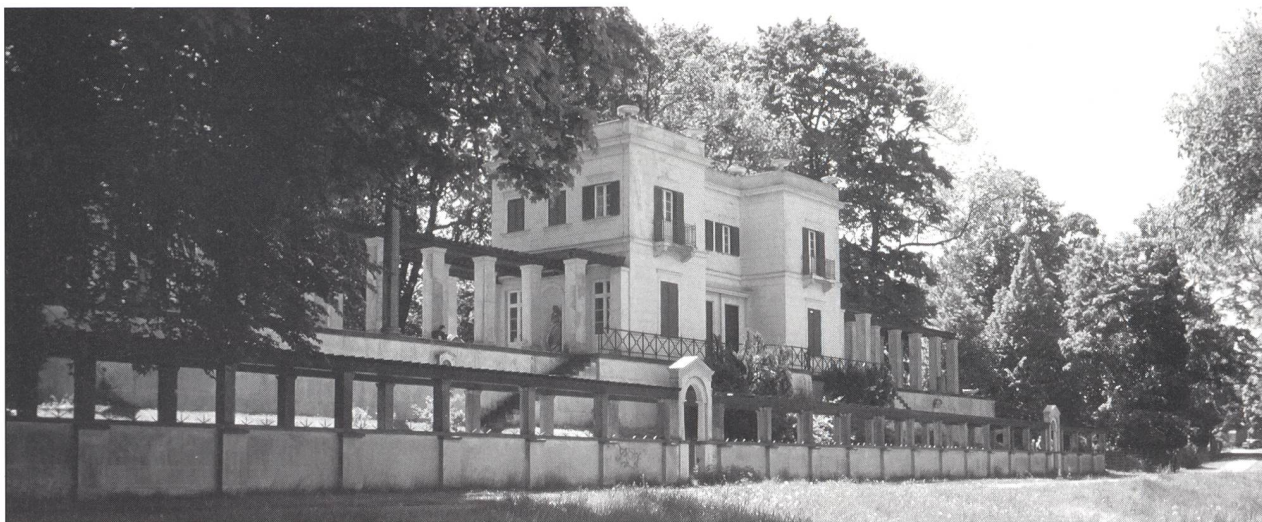
Abb. 4: Karl Friedrich Schinkel, Berlin-Wannsee, Kasino im Schlosspark von Glienicke (1824-25), Ansicht der Uferseite

Semestern Architekturstudium möglich, sondern eine Lebensaufgabe. Da die menschliche Natur unerschöpflich ist und es immer wieder neue Aspekte zu entdecken gibt, muss jedes Menschenbild zwangsläufig unzureichend sein. Wer wollte schon von sich behaupten, sich selbst wirklich restlos zu kennen? Und wer will sich wirklich anmassen zu wissen, was für andere das Richtige sei? Vielleicht wäre schon viel gewonnen, wenn sich vermitteln liesse, dass zum Bauen nicht nur der Entwurf eines Gebäudes, sondern auch der behutsame und differenzierte Entwurf einer Vorstellung von den Menschen gehört, die ihn beleben sollen. Dies ist keine Frage des im Unterrichts vermittelten Wissens, wohl aber eine Frage der dort vermittelten Einstellungen.