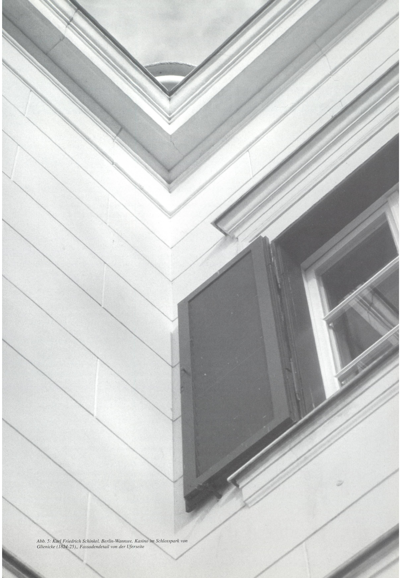
Abb. 5: Karl Friedrich Schinkel, Berlin-Wannsee, Kasino im Schlosspark von Glienicke (1824-25), Fassadendetail von der Uferseite