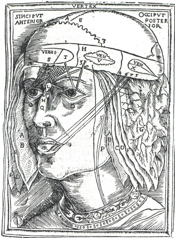
Johann Dryander, (1537), Schichten des Gehirns. (Aus: Die wissenschaftliche Illustration . Birkhäuser Verlag, 1992)