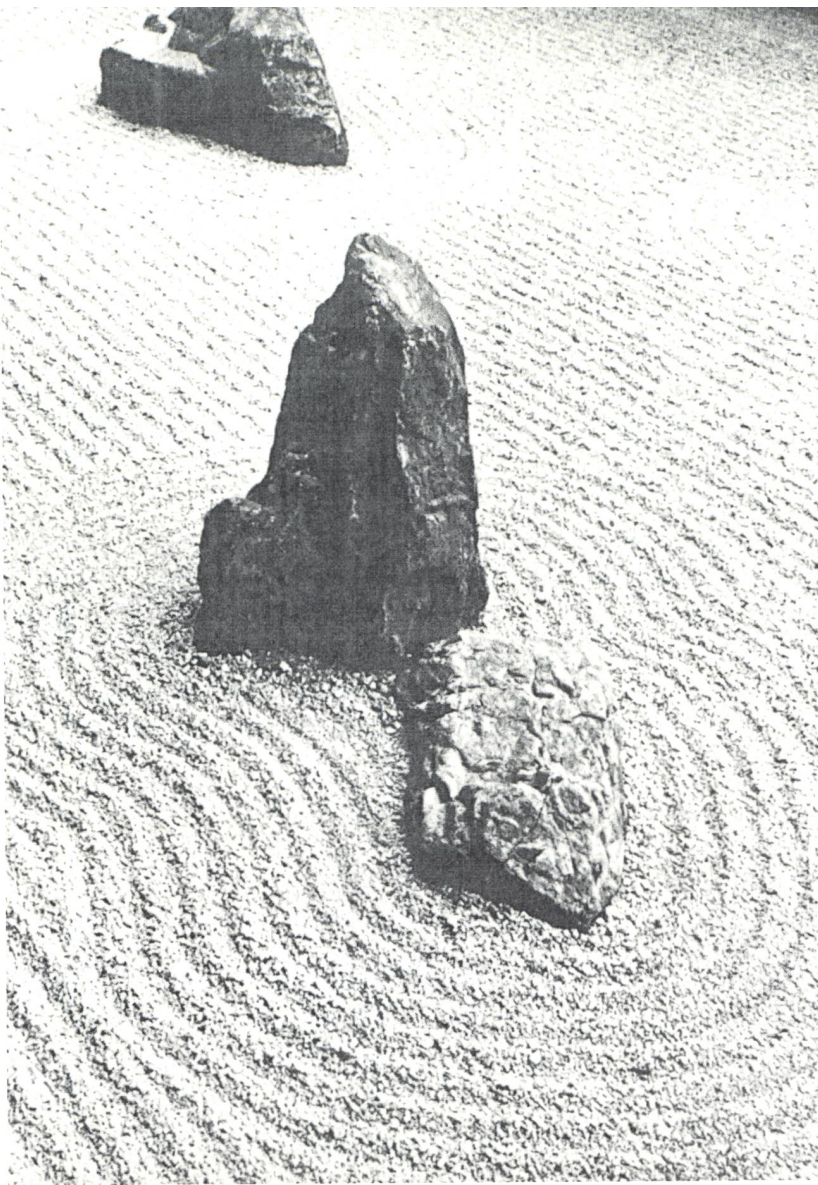
Steingarten des Nanzen-Tempels einer japanischen Zen-Schule. Meer und Gebirge. Wahrnehmung und Vorstellung sind austauschbar. (Aus: Das Bild als Schein der Wirklichkeit , Moos Verlag, 1972)