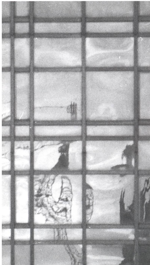
Ausschnitt aus der Hauptfassade des Palasts der Republik, (Foto: Phillip von Kap-Herr, 1999)

„Einschneidende Änderungen des alten Stadtbildes dürfen nur aus praktischen Gründen, niemals aber aus ästhetischen Gründen erfolgen. Denn die ästhetischen Gründe unterliegen der Wandlung, und da wir bisher immer unrecht gehabt haben, werden wir in alle Zukunft unrecht haben. Aber die bessere Einsicht kann zerstörte Kulturdenkmäler nicht wieder aufbauen.“ Adolf Loos 1