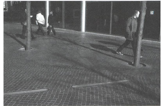
Maschinelle Kälte, erzeugt mit natürlichen Materialien. Berlin, Potsdamer Platz. Sony-Areal, Fussbodenbelag