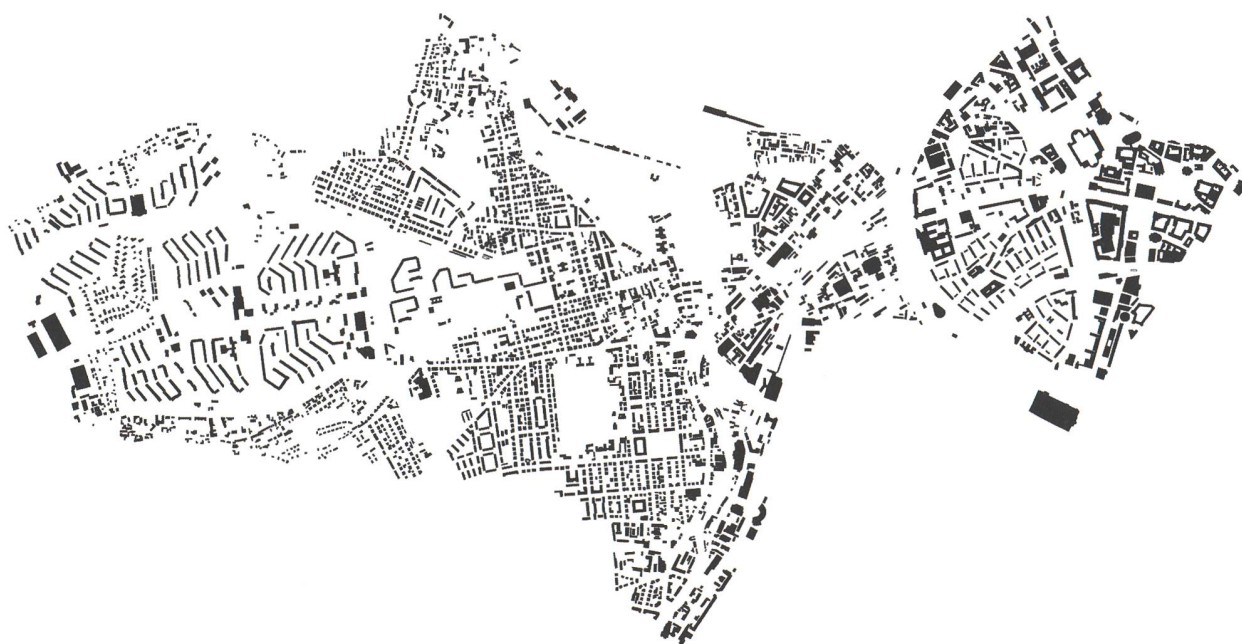
Schwarzplanausschnitt: Die Dresdener Altstadt mit dem Gründerzeitviertel Löbtau und dem Plattenbaugelbiet Gorbitz