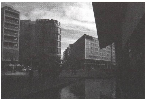
Grösse ohne Grosszügigkeit oder: eine Versammlung von Solitären macht noch keine Stadt. Berlin, Potsdamer Platz. Marlene-Dietrich-Platz