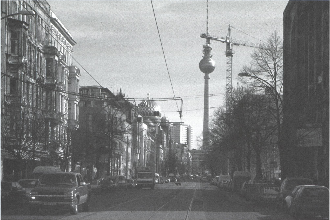
Strasse als Lebensraum. Grosszügig, weiträumig und trotzdem verdichtet. Berlin-Mitte, Oranienburger Strasse. Blick Richtung Osten