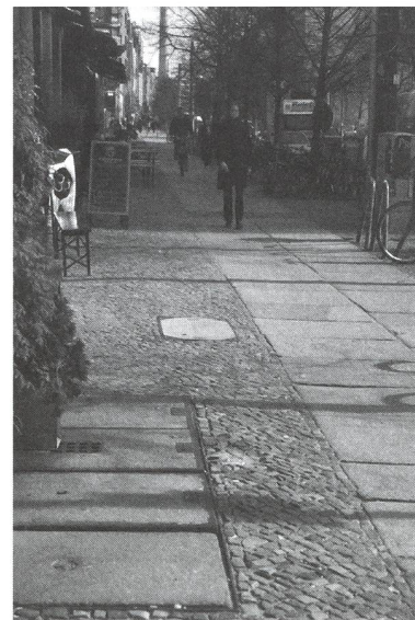
Ein Boden, der trägt und lebt. Berlin-Mitte, Oranienburger Strasse. Bürgersteig