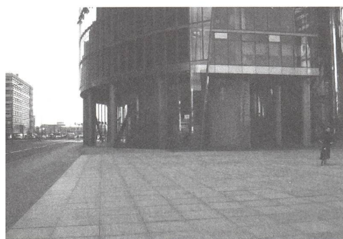
Stadt ohne Leben. Berlin, Potsdamer Platz. Eingang zur Sony-Plaza, Erdgeschosszone

Mit dem, was halbwegs intakte historisch gewachsene Städte ihren ehemaligen wie heutigen Einwohnern zur Verfügung stellen, hat all das nichts zu tun. Es bedarf keiner langatmigen Analysen um zu erkennen, dass die historischen Stadtzentren ein Vielfaches mehr an Ausstrahlung und urbanem Flair besitzen, als die Berliner Neubauareale. Warum begeistern wir uns für die Stadtzentren von Barcelona, Paris, Rom oder Budapest? Weil hier eine unverwechselbare Architektur mit der Kultur und dem Lebensgefühl der Einwohner zu einem einzigartigen Phänomen verschmolzen ist und eine unverwechselbare Identität erzeugt, die sich in unserem Bewusstsein unauslöschlich mit dem Namen dieser Städte verbindet. Die Geschichte zeigt, dass Stadt immer mehr war als nur kommerzielle Verwertungsfläche, dass kulturelle, soziale und kollektive Bedürfnisse ebenfalls ein zentrales und oftmals vorrangiges Anliegen