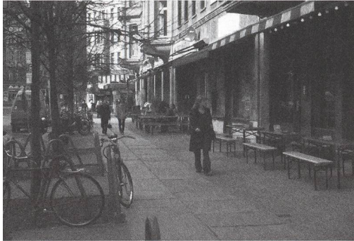
Urbanes Leben ohne Zwang. Berlin-Mitte, Oranienburger Strasse. Bürgersteig