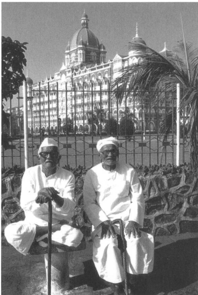
W. A. Stevens, Hotel Taj Mahal , Bombay, 1903

war als ein Hotel der Superlative geplant – was es bei seiner Eröffnung 1903 tatsächlich wurde. Mit 30 Suiten und 350 Zimmern ausgestattet war das Taj Mahal eines der ersten elektrisch beleuchteten Gebäude auf dem indischen Subkontinent.