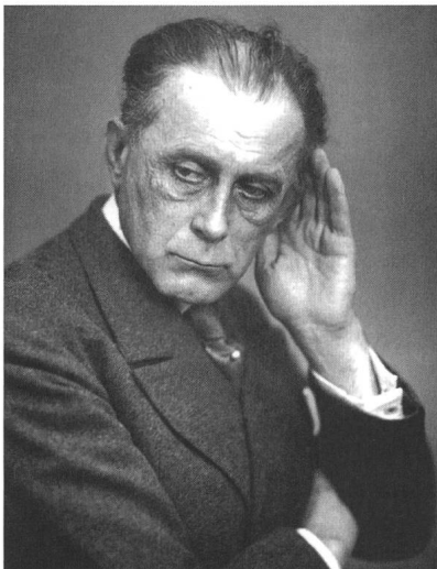
Adolf Loos, 1930