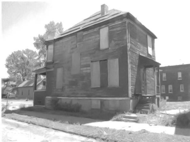
Detroit, Innenstadt, Foto vom Projektbüro Phillip Oswald

Kriege, Naturkatastrophen und Epidemien sind heute wie früher Faktoren, die das Wachstum städtischer Populationen beeinträchtigen. Daneben führen auch Deindustrialisierung, Suburbanisierung, räumliche Polarisierung und demographischer Wandel zum Schrumpfen.