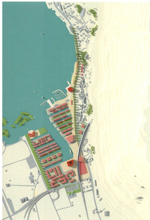
Metron, Hafencity Flüelen , Studie, perspektivischer Lageplan, 2005.

Trotz landschaftlich sehr attraktiver Lage mit schönen Seitentälern hat der Kanton Uri kein spezifisches touristisches Profil und kann sich gegenüber anderen Alpentälern nicht positionieren. Andermatt ist der einzige Tourismusort mit nationaler Bekanntheit im Kanton. Die Hotels in Uri haben insgesamt nur eine Auslastung von 25% und die durchschnittliche Übernachtungsdauer beträgt lediglich 1,4 Tage. Der Kanton ist heute wohl doch hauptsächlich durch die Staumeldungen am Gotthard bekannt.