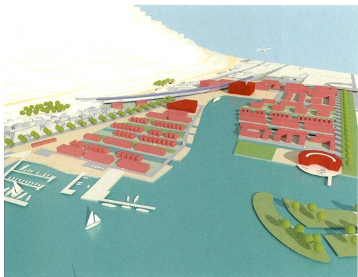
Metron, Hafencity Flüelen , Studie, Perspektive, 2005.

Wie sieht die Zukunft des Transitraumes Kanton Uri aus? Wie kann dieses Zentralschweizer Alpenental eine Perspektive für die Zukunft entwickeln? Diese Aufgabe stellte der Kanton vier Planungsteams im Rahmen eines Studienauftrags zur Erkundung der Langfristperspektiven der Siedlungs-, Landschafts- und Infrastrukturentwicklung. Aus den Vorschlägen aller Teams wird das begleitende Expertenteam Empfehlungen für den Urner Regierungsrat ausarbeiten.