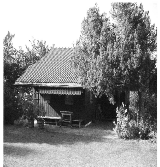
«dort im Chalet in den Bergen», ohne Ort, 2006