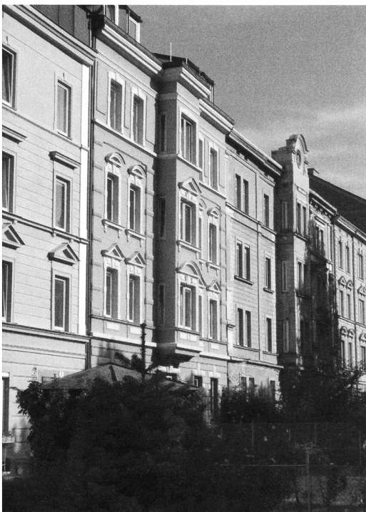
«Hier in der Stadtwohnung...», ohne Ort, 2006, Foto von Nicola Hilti.

Dies gilt gleichfalls für die Zeit der Jugend, die eine breite Palette multilokaler Wohnformen parat hält. In der Freizeit übernachteten viele Jugendliche mal bei dieser Freundin und mal bei jenem Kollegen. Oftmals kommt ein zu Ausbildungszwecken genutzter Wohnsitz zum nach wie vor bestehenden «Kinderzimmer» im Elternhaus hinzu: ein Lehrlings- oder Studentenheim, ein WG-Zimmer, ein Personalhaus oder eine andere vom Ausbilder zur Verfügung gestellte oder selbständig organisierte Wohnstatt. Auch das Ableisten der Zeit in der Rekrutenschule geht mit multilokalem Wohnen einher.