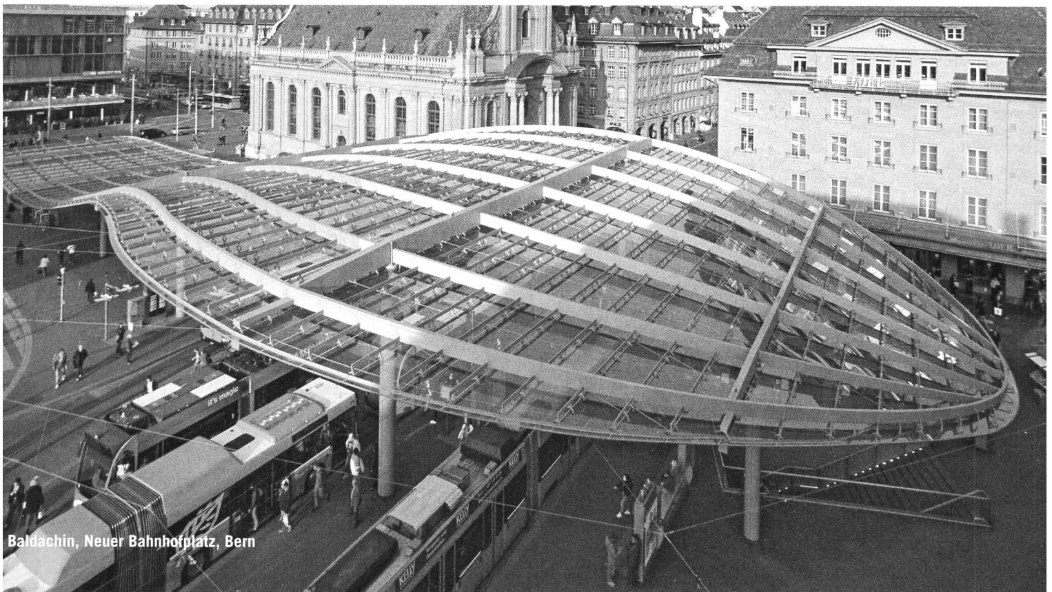
Baldachin, Neuer Bahnhofplatz, Bern

michelle.durham@bastianello.net hänggerstasse 105 CH-8037 zürich +41 (0)44 440 60 89