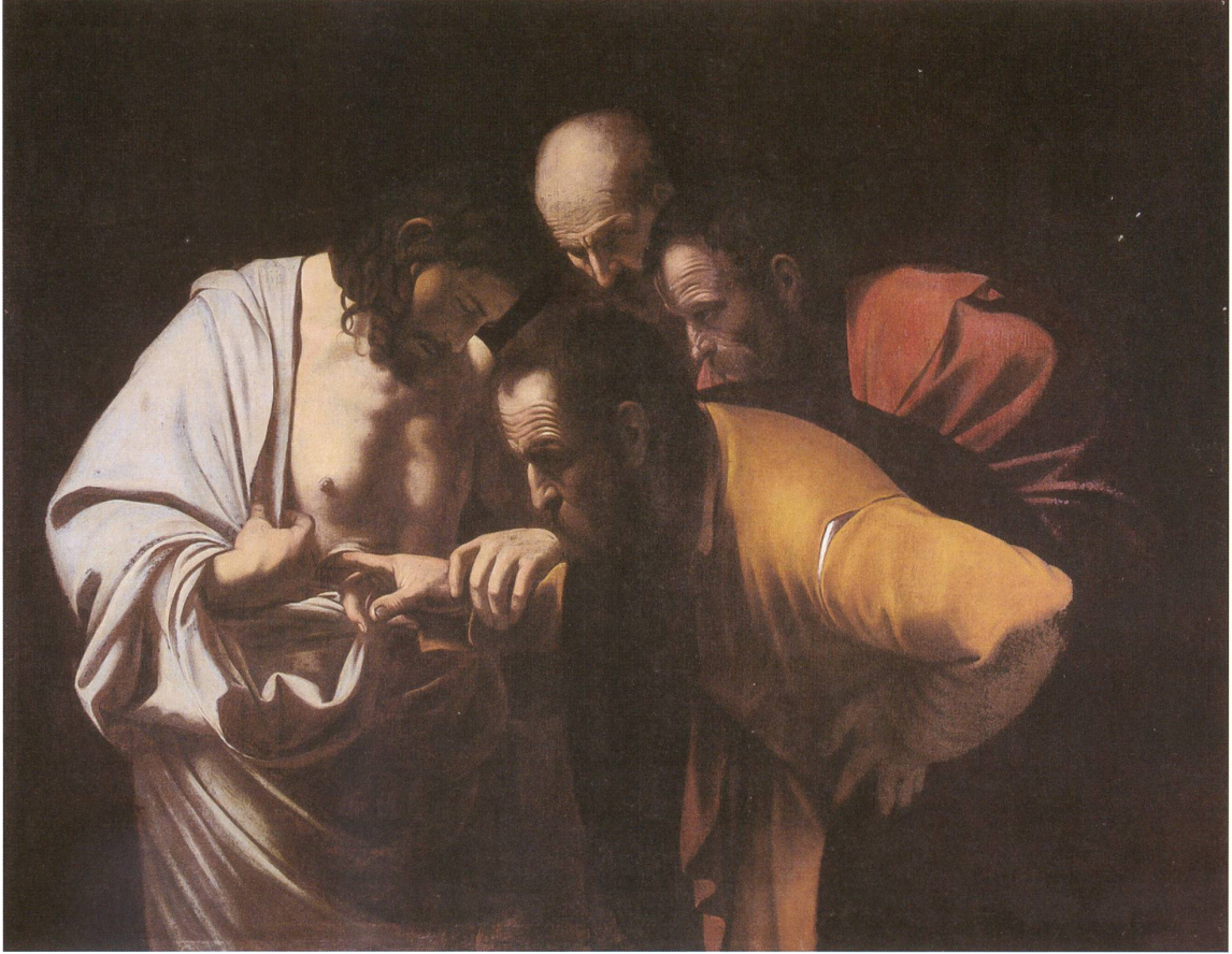
fig. a Caravaggio - Der ungläubige Thomas (1601 - 02) Öl auf Leinwand, 115 x 146 cm Neues Palais, Potsdam