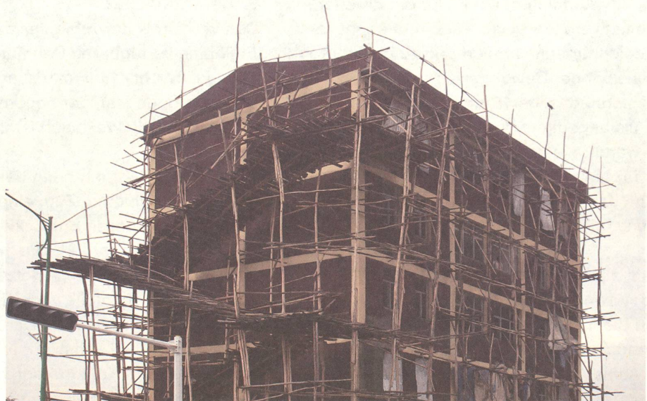
fig. b Bau eines städtischen Wohnblocks in Addis Ababa