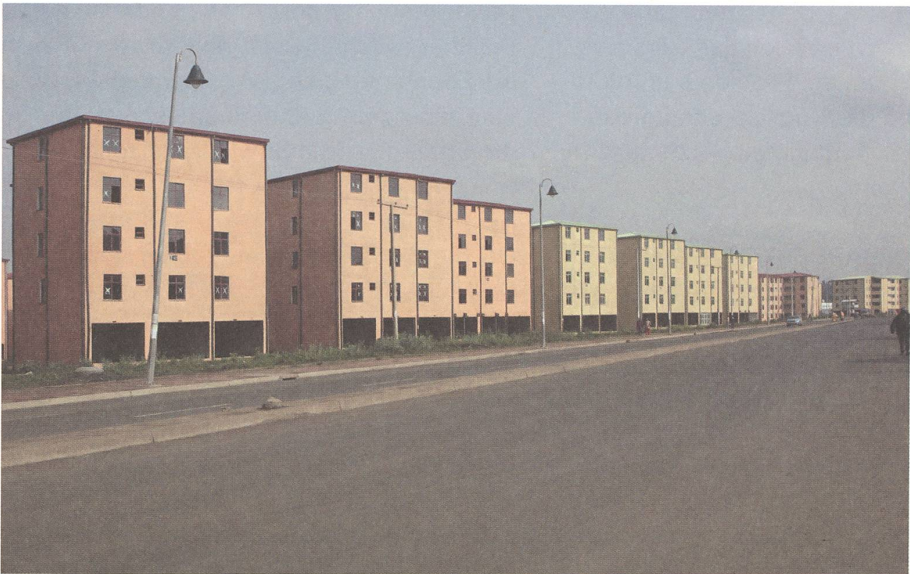
fig. d Neue Wohnüberbauung ausserhalb von Addis Ababa