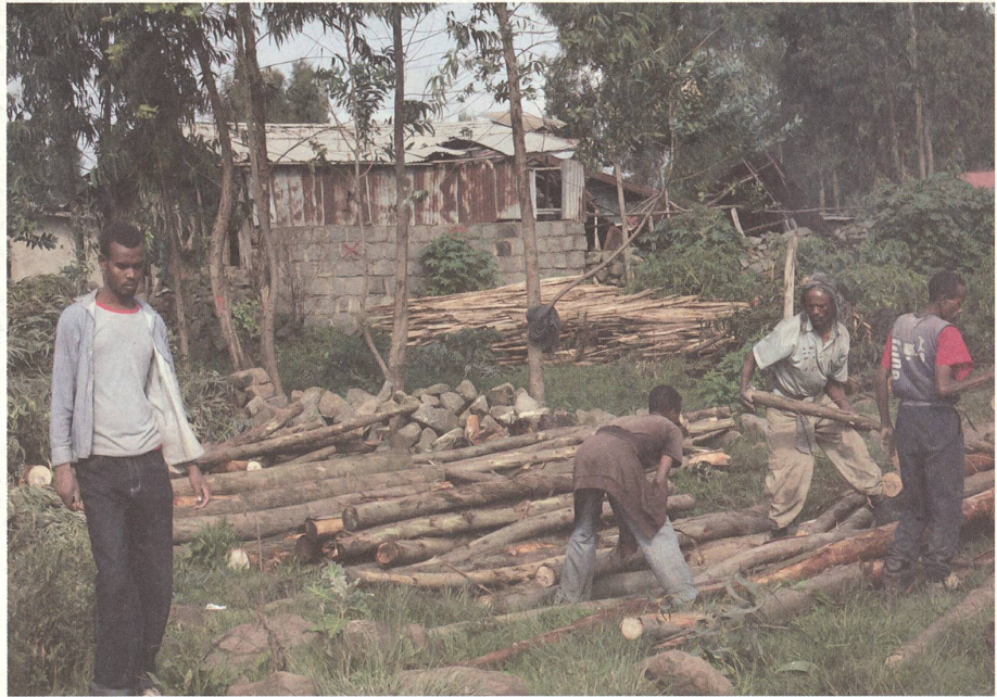
fig. a Abholzung für Konstruktionsholz