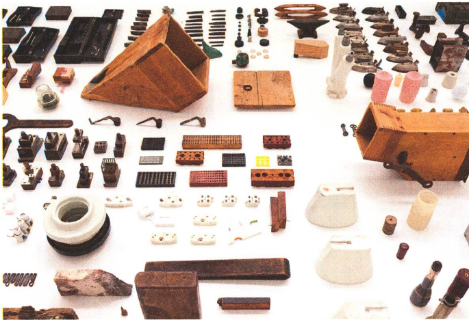
fig. b Ausstellung IN LOVE TO, 2011 Aus der Reihe Formel X im DAZ Berlin, photo © Dawin Meckel / OSTKREUZ.

So kamen und kommen beständig neue Sachen hinzu und verändern das Bild unseres Archivs. Mittlerweile haben neben den analogen, greifbaren Dingen, auch digitale ihren Platz gefunden. Dabei ist die Botschaft, die