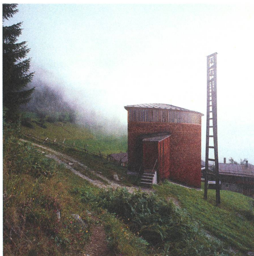
fig. d, e, f Kapelle Sogn Benedetg – Sumvitg.

ihn beispielsweise durch angeschnittene Formen imaginär über den Bildrand hinaus fortsetzen und erweitern.