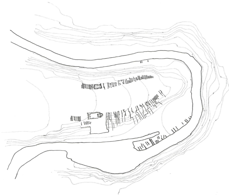
fig. c Philip Bürgi, Berne. Travail présenté dans le cadre du cours Éléments d'analyses urbaines et territoriales à l'EPFL en 2012