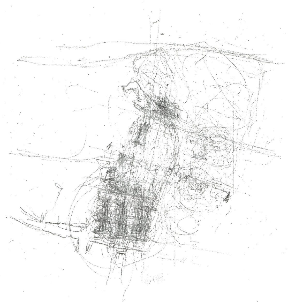
fig. b Croquis de l'auteur, dessiné lors de critiques à l'Université catholique de Louvain, 2012