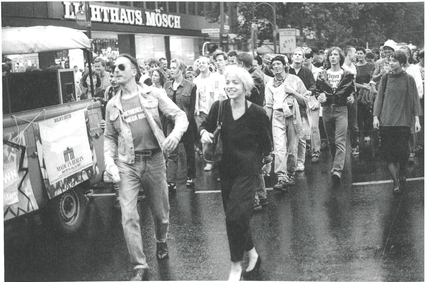
Loveparade «Friede, Freude, Eierkuchen», Berlin 1989