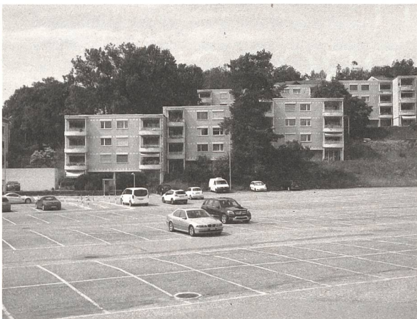
A Zwischen Hauptstrasse und Hofeinfahrt C Zwischen Stellplatz und Shoppingcenter E Zwischen Wiese und Wohnblock