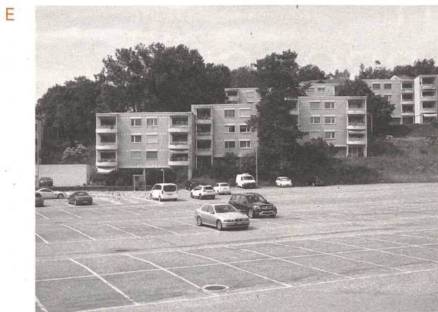
A Zwischen Hauptstrasse und Hofeinfahrt C Zwischen Stellplatz und Shoppingcenter E Zwischen Wiese und Wohnblock