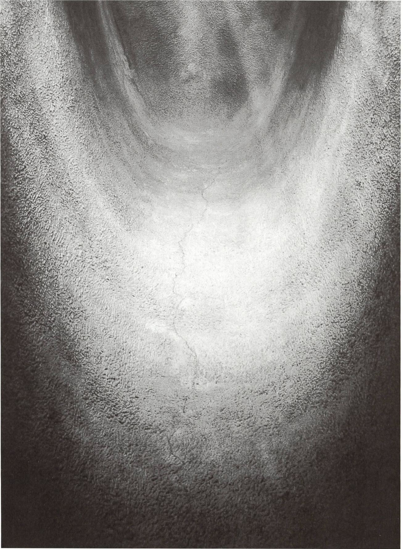
Cabo, David Hugo. Inside , at Notre Dame du Haut, Le Corbusier, 1955, 2019.