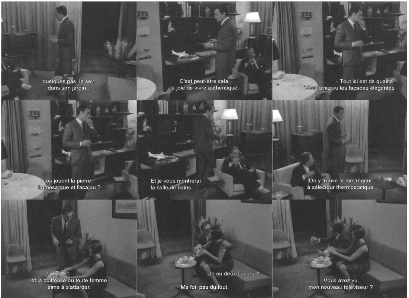
(Abb. a) Szene in der Art eines Werbespots für das Wohnen in «Elysée 2», 1964.