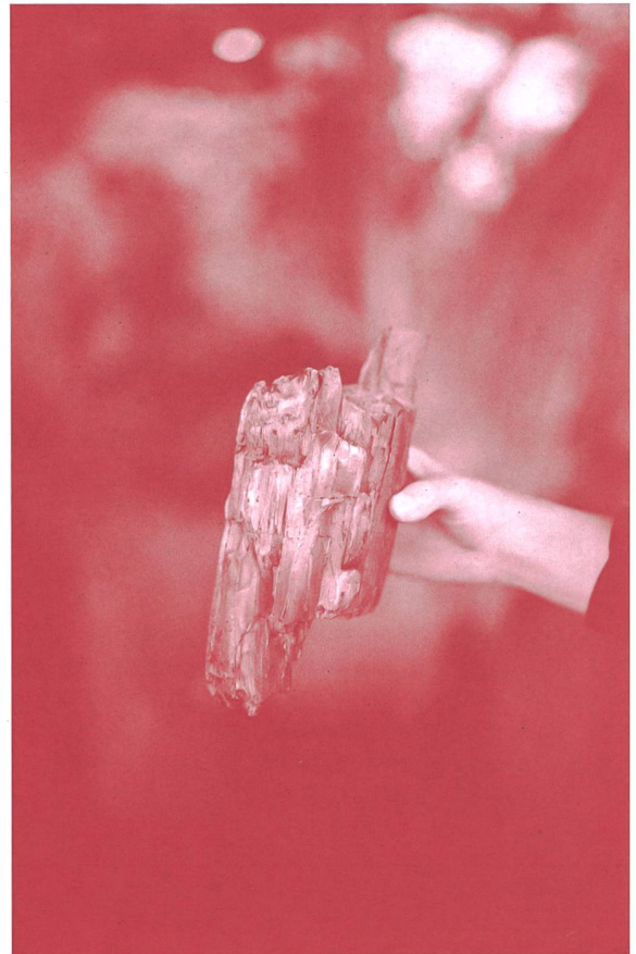
A Kohlplatz Under Brambode. Bild: trans magazin C Kohlplatz Pilgerweg. Bild: trans magazin