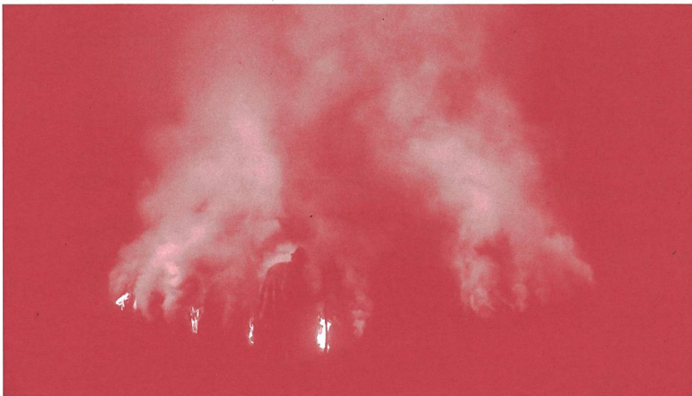
E «Köhlernächte», Schweiz 2017.