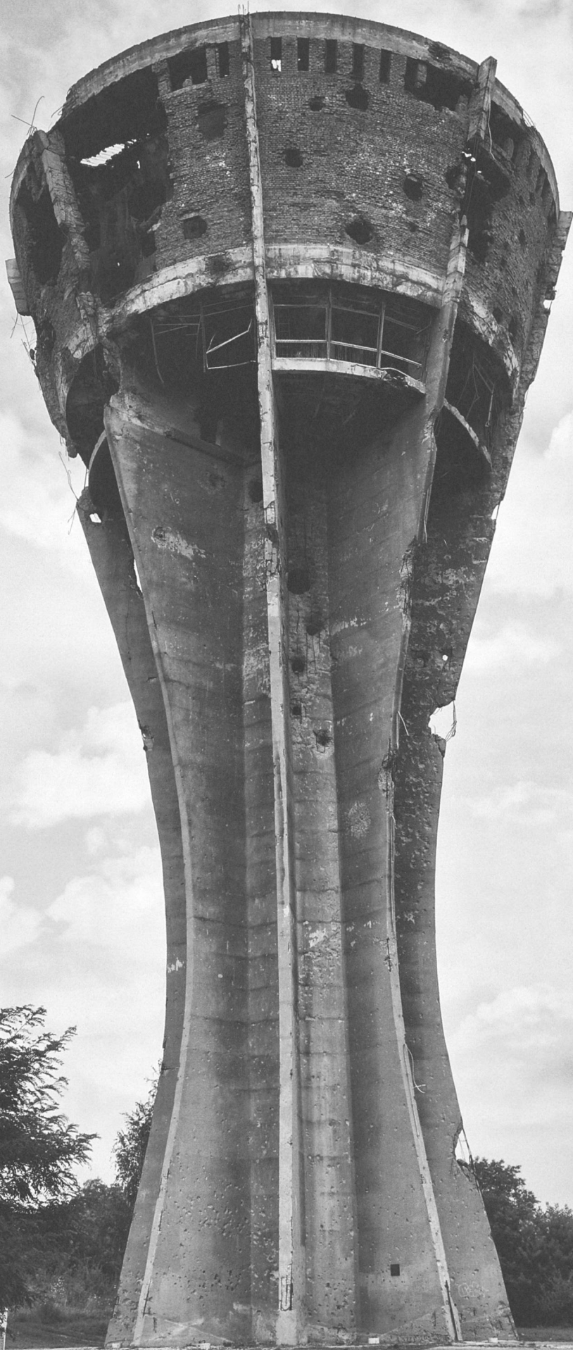
196 / Tsantsa #17 / 2012 / Photo 14