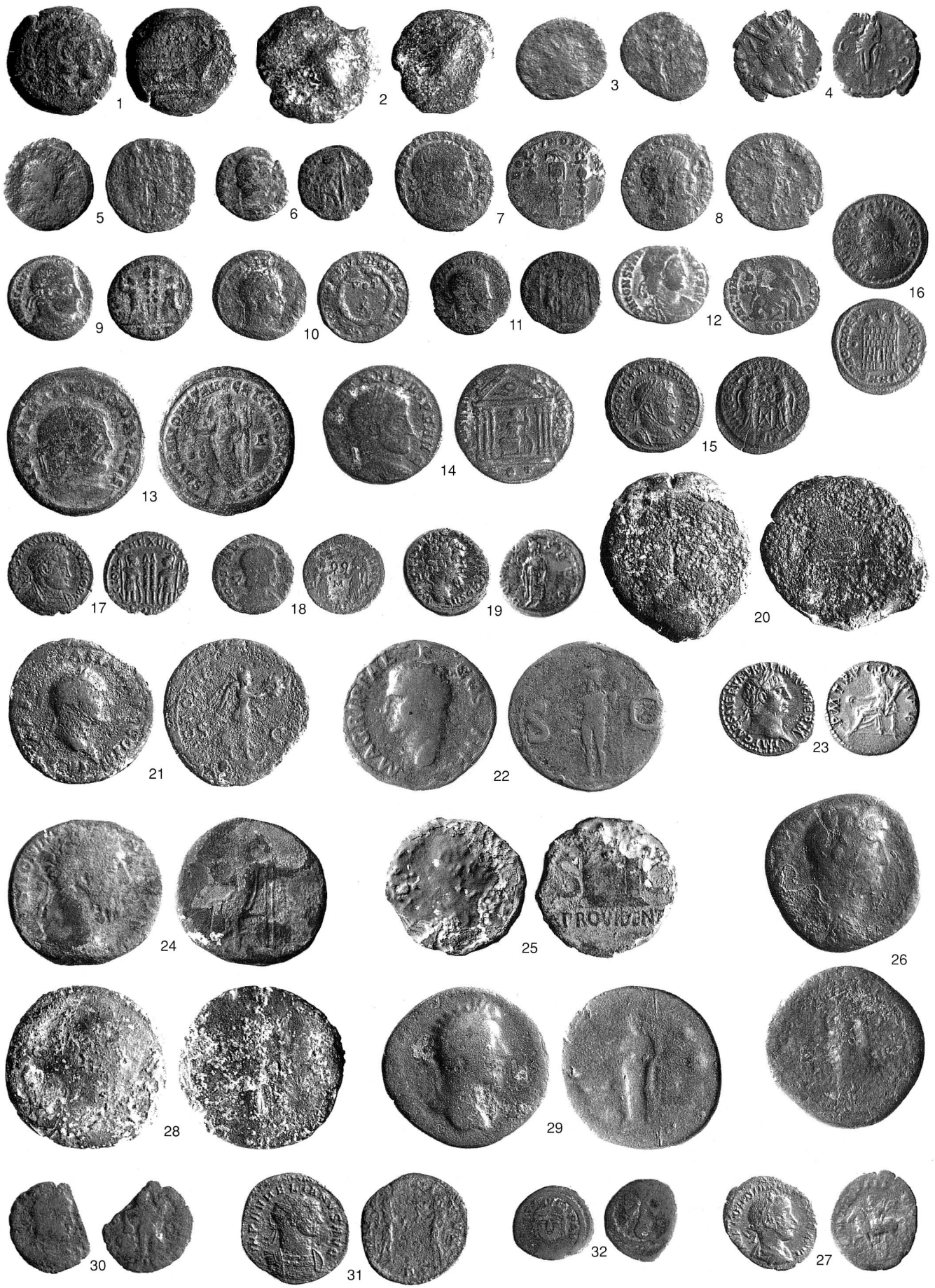
Taf. 1 Römische Fundmünzen aus dem Kanton Zug. 1–18 Baar-Lättich, 19 Baar-Talacher, 20–22 Baar, 23 Cham-Bergacher, 24 Cham-Hagendorn, 25–27 Cham-Heiligkreuz, 28–31 Cham-St. Andreas, 32 Menzingen-Edlibach. Massstab 1:1.