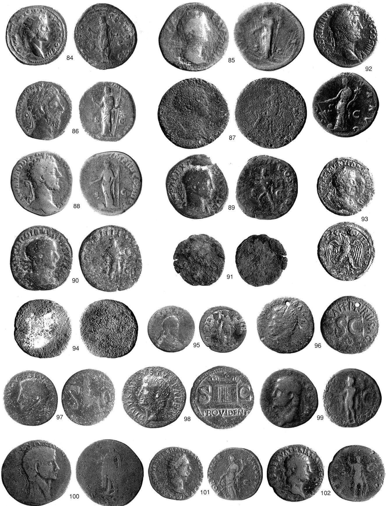
Taf. 5 Römische Fundmünzen aus dem Kanton Zug. 84–90 Risch-Ibikon, 91 Steinhausen-Heidmoos, 92 Unterägeri-Waldheim, 93 Zug-Kollermühle, 94 Zug-Otterswil, 95 Zug-Zugerberg, 96–102 Kanton Zug? Massstab 1:1.