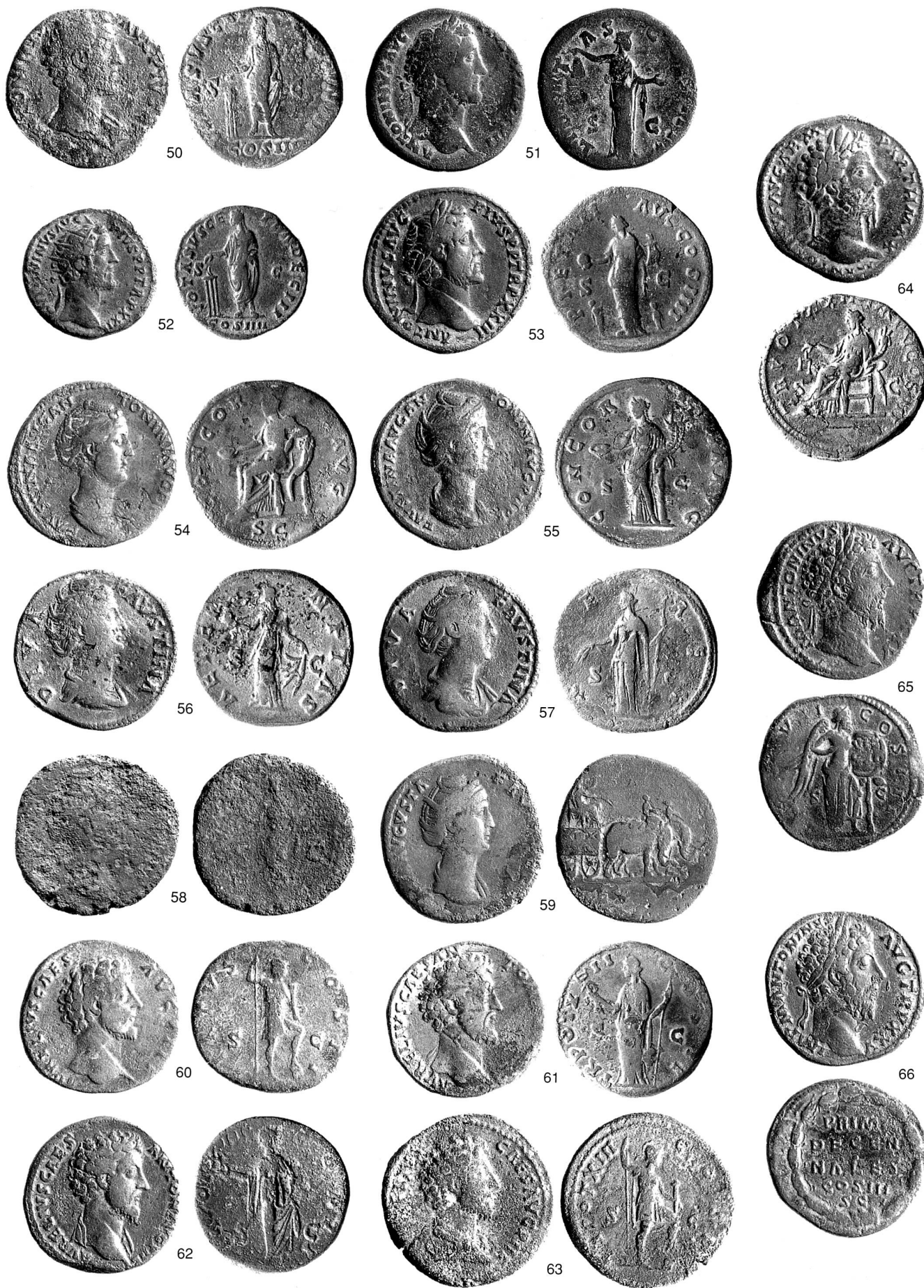
Taf. 3 Römische Fundmünzen aus dem Kanton Zug. 50–66 Risch-Ibikon. Massstab 1:1.