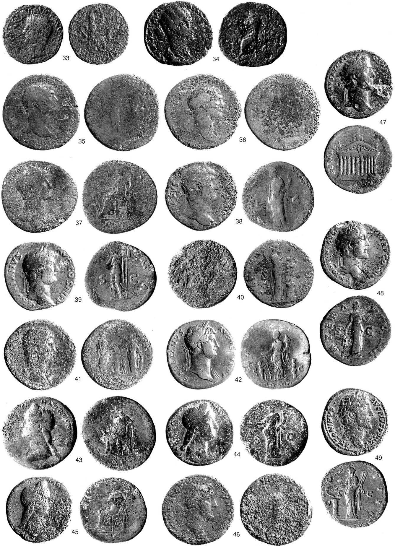
Taf. 2 Römische Fundmünzen aus dem Kanton Zug. 33 Neuheim-Unterdorf, 34 Oberägeri-Rothaus, 35-49 Risch-Ibikon. Massstab 1:1.