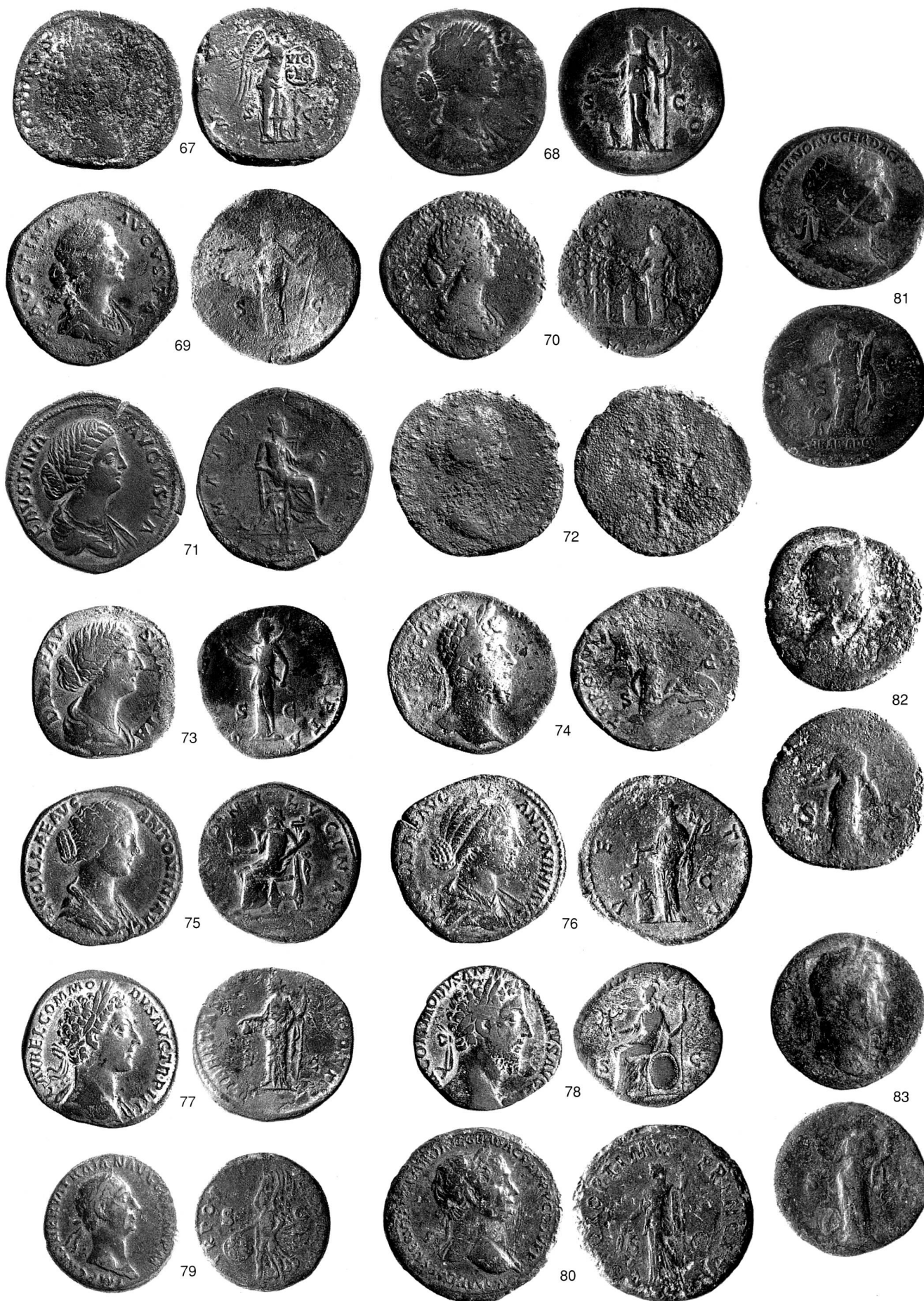
Taf. 4 Römische Fundmünzen aus dem Kanton Zug. 67–83 Risch-Ibikon. Massstab 1:1.