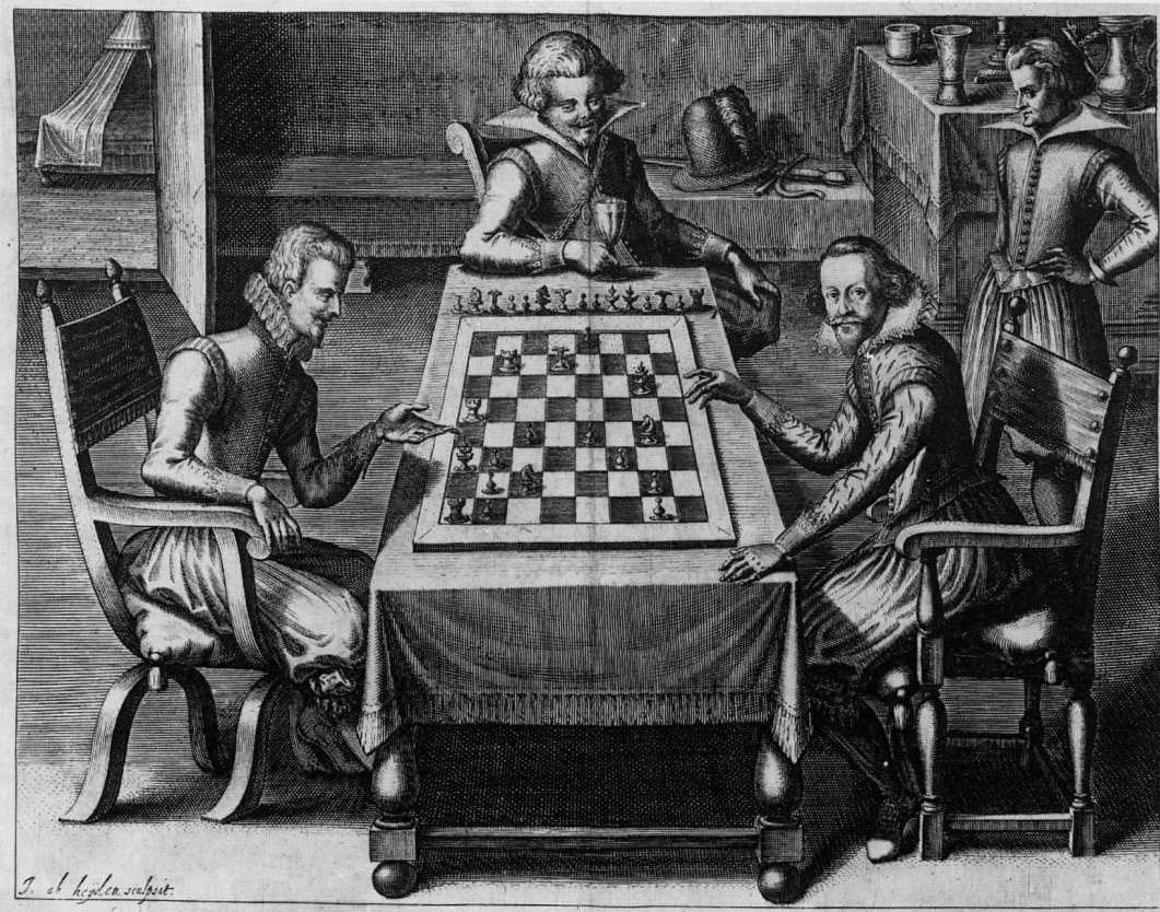
Abb. 1 Herzog August von Braunschweig-Lüneburg (rechts) beim Schachspiel. Gustavus Selenus, Das Schach- oder Königspiel, Leipzig 1616. Herzog August Bibliothek, Wolfenbüttel.