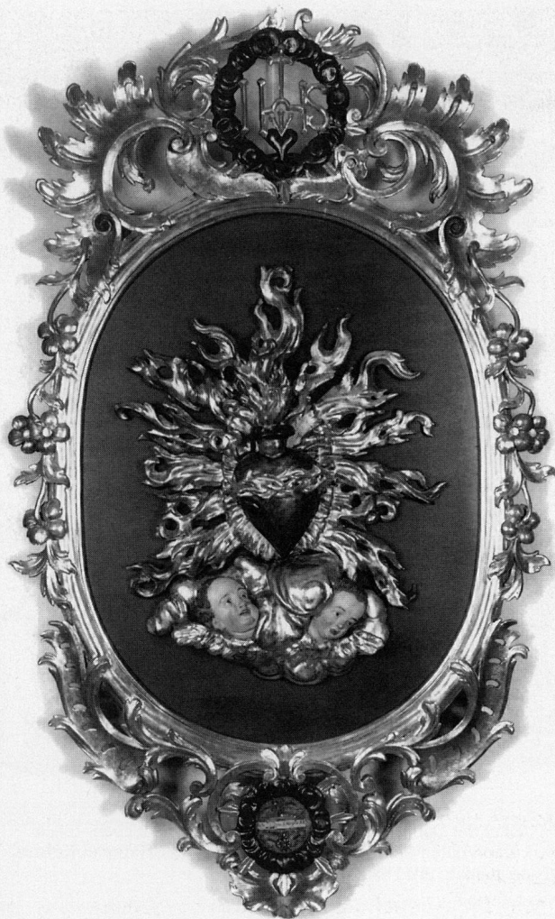
Abb. 3 Herz Jesu, Holzrelief in Rahmen, 18. Jh.

figuren, das Salzburger Loretokindlein und das Prager Jesulein, das bekannteste aller Jesuskind-Gnadenbilder.