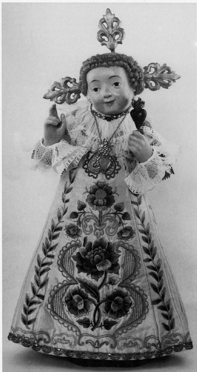
Abb. 2 Christkind, sogenannter «Seelenbräutigam», 17. Jh. und spätere Zutaten. Kloster St. Anna, Gerlisberg/Luzern.

Einige der Jesuskindfiguren wurden zu Gnadenbildern, nachdem sie nach Auffassung der Gläubigen Wunder ge- wirkt hatten. In der Ausstellung waren drei dieser Gnaden- bilder ausführlich dokumentiert: Das Sarnen Christkind, eine der ältesten überlieferten mittelalterlichen Jesuskind-