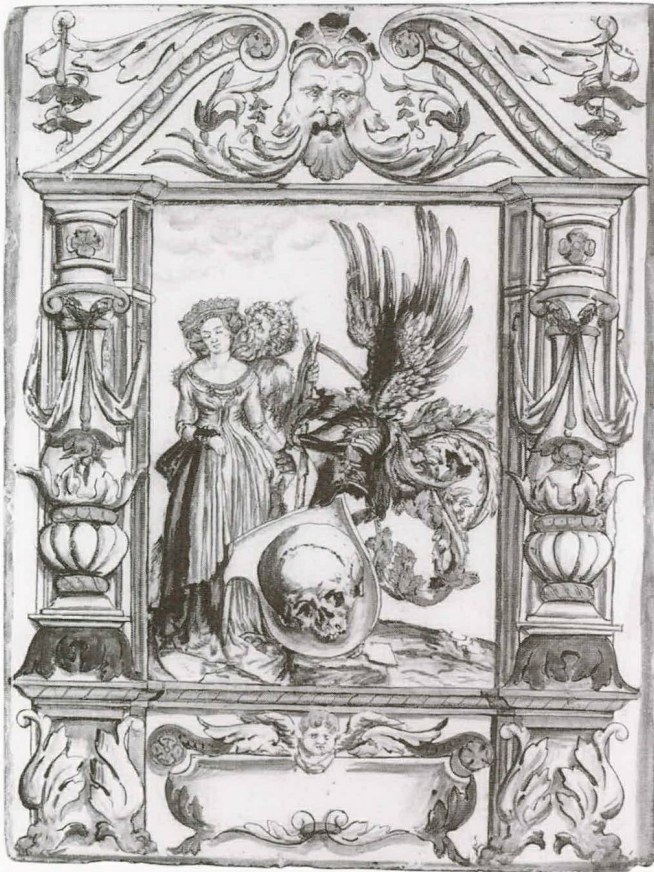
Abb. 4 Ofenkachel mit Darstellung der Vergänglichkeit des Lebens (nach Dürers Kupferstich «Wappen der Vanitas») aus der Hafnerei Keiser. Fayence, bemalt, um 1880.