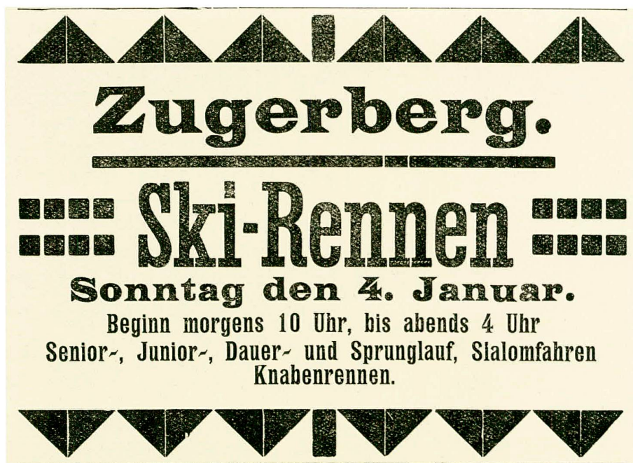
Abb. 1 Erstes kantonales Grosseereignis im Jahr 1914 war das Skifest auf dem Zugerberg.

Das neue Jahr 1914 begann winterlich. Es gab viel Schnee, was dem grossen Skifest auf dem Zugerberg am 4. Januar mit Sprunglauf, Dauerlauf, Slalom, Damenrennen und Fassdaubenrennen zum Erfolg verhalf (Abb. 1). Der Wintersport, in Zug zu Beginn der 1890er Jahren von einigen Jünglingen eingeführt und lange Zeit als skurriles Tun einiger Spinner betrachtet, war zum gesellschaftlich akzeptierten Vergnügen geworden, wozu sicher auch die