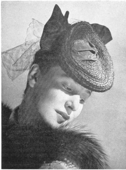
« Myra » Original Schiaparelli