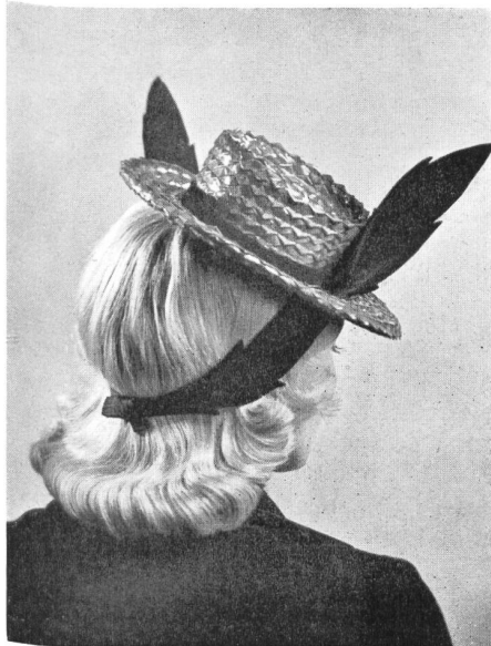
Original Ateliers E. Bähler Bern A. G.

Pariser und Schweizer Original-Modelle ausgeführt mit « Myra » und « Rio » (Schutzmarke) der Firma Georges Meyer & Co. A. G., Wohlen.