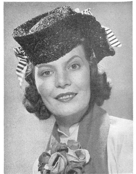
Original Blanche & Simone

Pariser Original-Modelle ausgefertigt mit « Rapal » (Schutzmarke) der Firma Jacob Isler & Co. A. G., Wohlen.