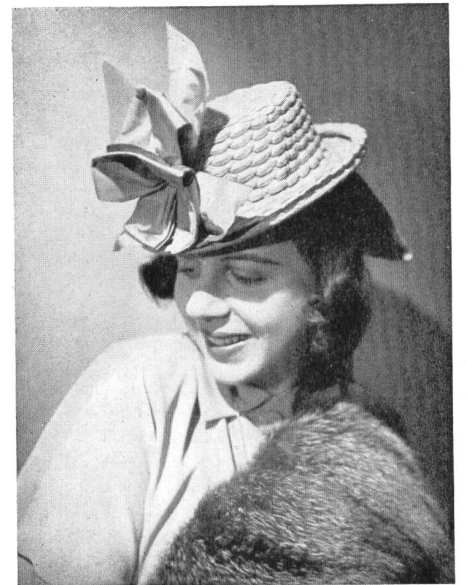
« Myra » Original Claude Saint-Cyr