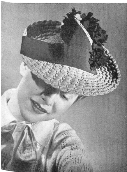
« Myra » Original Marie Alphonsine

Modelos originales de casas parisienses y suizas, confeccionados con las pajas « Myra » y « Rio » (marcas depuestas) de Georges Meyer & Cia S. A., Wohlen.