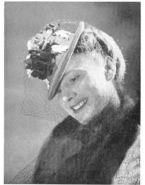
« Rio » Original Mermoud