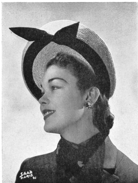
« Myra » Original Muller