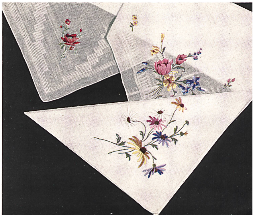
Taschentücher — mouchoirs — pañuelos — fazzoletti Union A.-G., St. Gallen.

Fazzoletti da signori e signore, bianchi e colorati, in linone, seta, cotone, filo, mezzo filo, ecc., stampati, ricamati con iniziali a mano ed orlati pure a mano