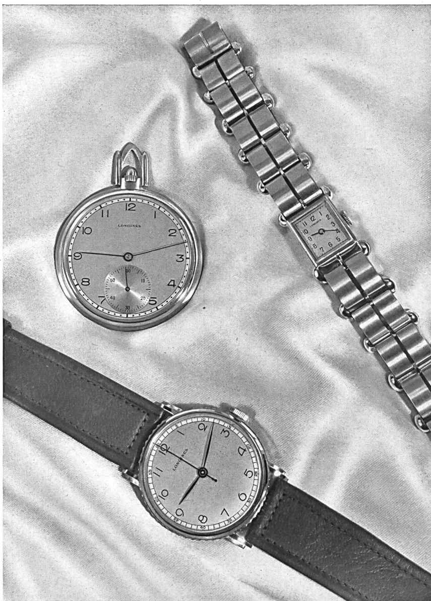
Compagnie des Montres Longines, Francillon S.A., St-Imier.