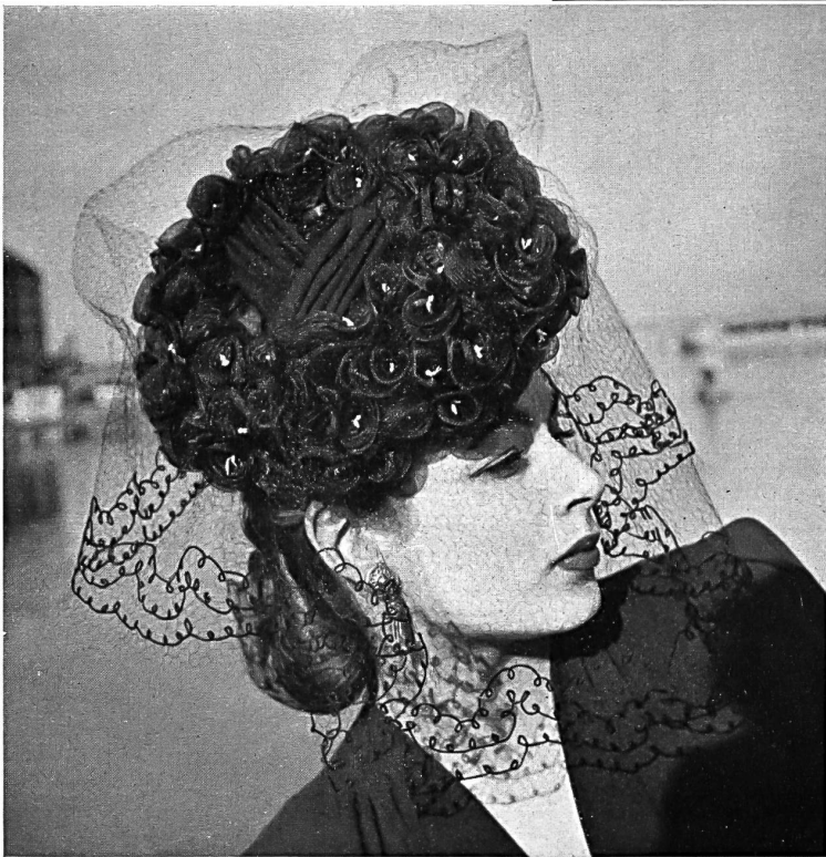
Reichenbach & Co., St. Gallen. « Recofibra » Zellwolle bedruckt. Gehr. Dreifuss A.-G., Wohlen. Strohgeflechte. Modelle Sauvage Couture.