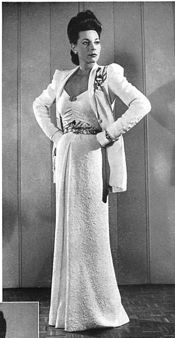
Mettler & Co. A.-G., St. Gallen. Matelassé façonné Kunstseide. Modell Léon Fischer.