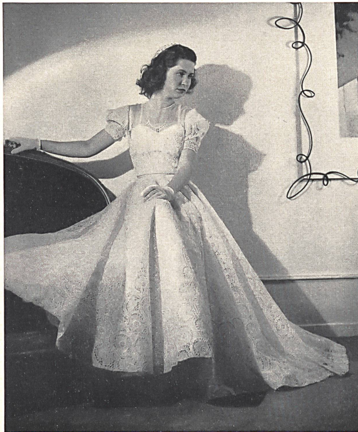
Bischoff & Müller A.-G., St. Gallen. Brautjungferkleider aus Organdi, bestickt, « Fleurs crochetées ». Modell Andrée Wiegandt.