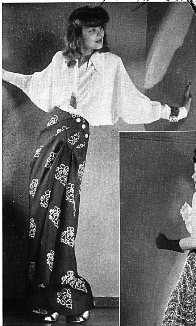
Seidenstoffwebereien vorm. Gebr. Näf A.-G., Zürich.

Toile « Kiang-si » Zellwolle uni und bedruckt.